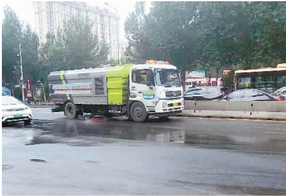
环卫车辆对主干街路进行清扫保洁作业。

农村局等部门将依据各自职责分工,形成合力,深入推进农村生活垃圾治理,持续开展垃圾散乱堆放点排查整治,加强日常清扫保洁,强化环卫设施管理,落实长效运行管护机制。