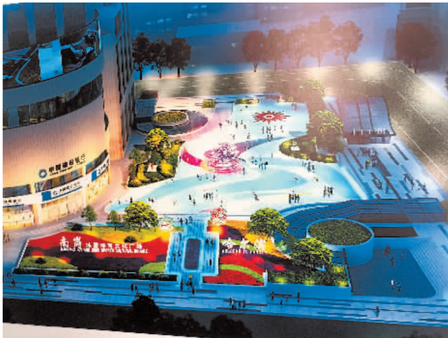
颐园广场改造项目效果图。