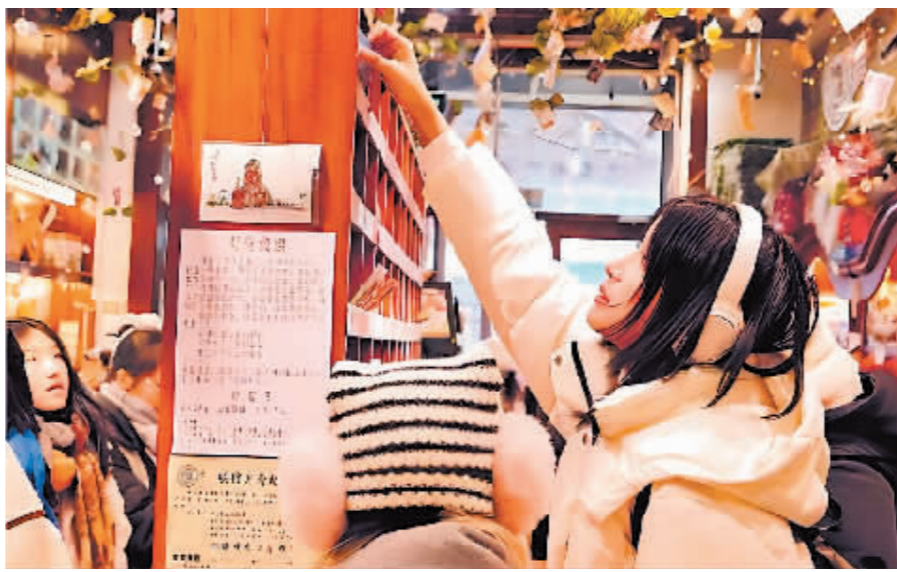
主题邮局吸引众多游客打卡。(资料片)

上一个冰雪季,在中央大街主题邮局和冰雪大世界主题邮局,第一代邮车缩小版、绿色邮筒钥匙链、冰雪城堡造型的冰箱贴及各式精美的明信片,深受游客欢迎。邮资封片、加盖旅游纪念戳等邮政品牌服务受到旅游收藏者的青睐。以五常稻花香为代表的哈尔滨大米展示了黑土农产品的特色与品质。最火热的中央大街主题邮局在冰雪旅游旺季接待游客15万余人次。 融合地方特色、提升服务质量和能力,为主题邮局增添了活力。下一步,市邮政管理局将加大监督指导力度,督促企业打牢安全基础,保障服务质量,做好普遍服务,鼓励企业抓住哈尔滨打造冰城夏都避暑康养优选地和举办亚冬会的有利时机,挖潜增效,线上线下结合,将主题邮局打造成邮政文化宣传和冰城特色推介的窗口和名片。