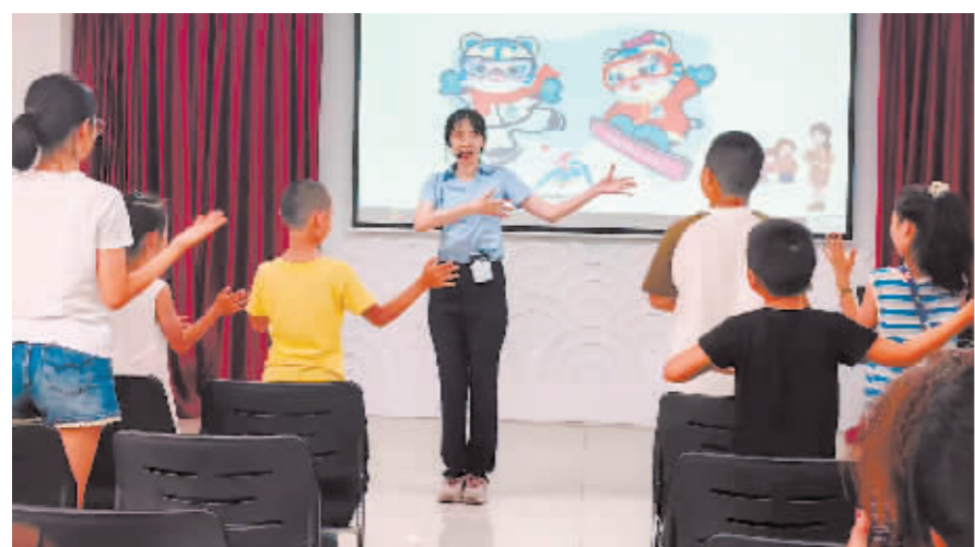
孩子们“沉浸式”学习英语。

本报讯(李浩森 记者 杜菲菲文/摄)近日,道外区东原街道“暑期学英语 一起迎亚冬”文明实践活动启动,邀请辖区青少年、党员、社区文明实践志愿者等共同参与,着力营造浓厚的全民迎亚冬氛围。