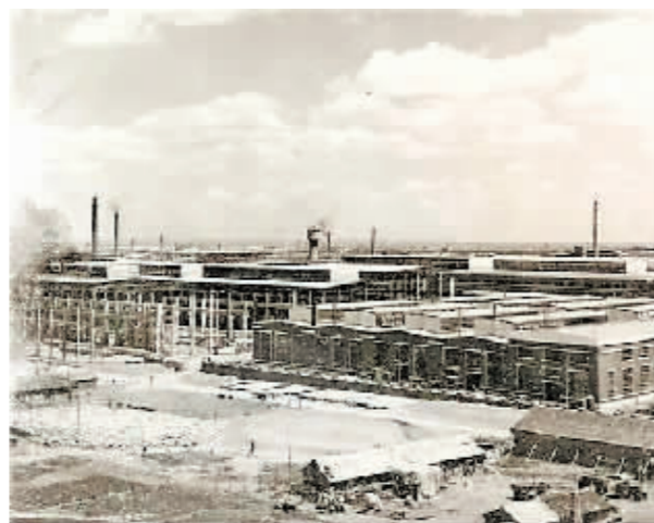
哈尔滨锅炉厂厂房建成初期。

简介: 哈尔滨锅炉厂是我国1954年在苏联的帮助下,建设的国内第一个现代化的电站锅炉研发与制造基地。哈尔滨锅炉厂一厂房于1955年建成,见证了我国电站锅炉行业从无到有、从有到优的发展历程。