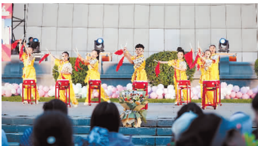
孩子们的精彩表演引来观众阵阵掌声。

本报讯(记者 于秋莹文/摄)为迎接2025年第九届亚冬会,日前,道里区在群力月光舞台和爱建汇励99城市生活公园舞台开展“礼迎亚冬会·文明我先行”系列少儿文化展演活动。