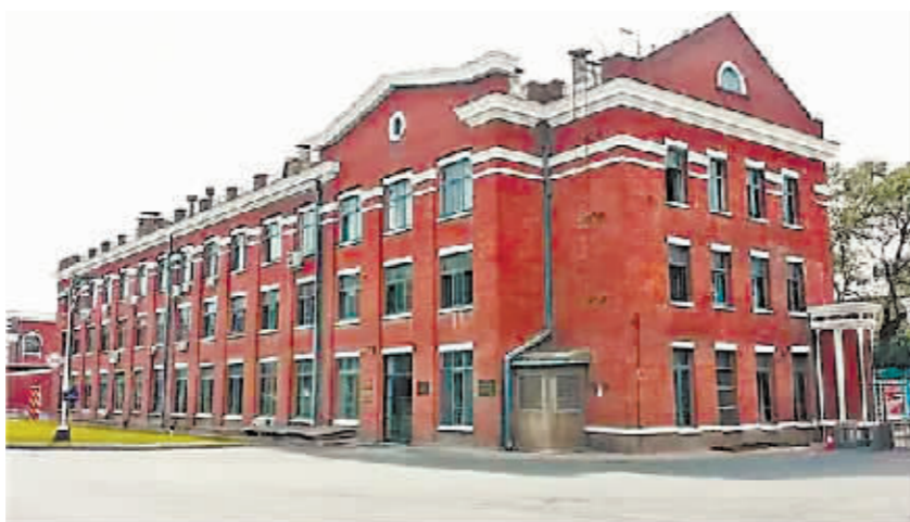
东北轻合金加工厂技术中心。