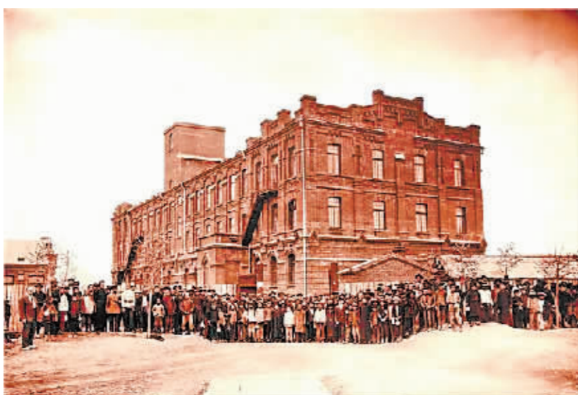
哈尔滨卷烟厂旧址。