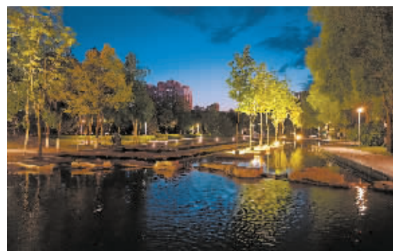
公园璀璨夜景美不胜收。

本报讯(记者 霍亮文/摄)盛夏，哈市各大城市公园浪漫迎客。夜晚，位于道里群力新区的金河公园在灯光、碧水和鲜花的映衬下璀璨如画。