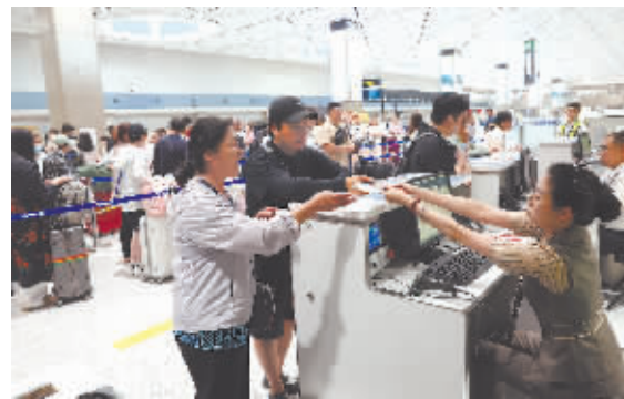
哈机场客流量同比上涨一成。

本报讯(仇建 记者 刘希阳)进入暑期，前来哈尔滨的中外游客络绎不绝。记者从哈尔滨太平国际机场获悉，7月1日至16日，哈机场运送旅客105.6万人次，同比增长10%。