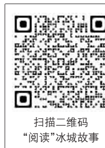
扫描二维码“阅读”冰城故事

“活地图”小程序开发设计了“历史建筑”“旅游路线”“文化街区”“博物馆”4大功能板块，并整体以复古的美术风格，形象呈现出哈尔滨市历史文化资源。特别是在“历史建筑”板块中，通过“凝固乐章·品读”的功能拓展，可实现用“音频”聆听老建筑故事、用“导航”探寻老建筑所在、用“全景”领略老建筑风貌。同时，中俄英三种语言的文字介绍，满足中外游客的不同需求。“活地图”小程序以其丰富的功能、生动的方式让公众随时跨越时空走近“老房子”，品读城市历史。