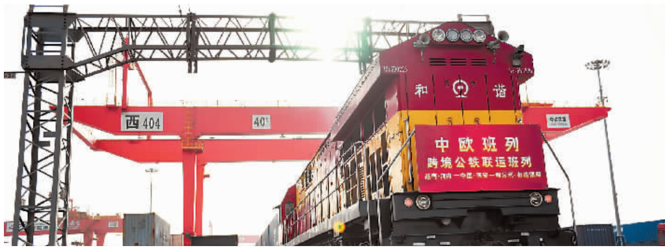
中欧班列(越南·河内—中国·西安—匈牙利·布达佩斯)跨境公铁联运班列准备发车。

改革开放,承载了中国共产党人至上、实干兴邦、自我革命的政治气魄和历史担当。放眼世界,没有哪个国家和政党能在短时间