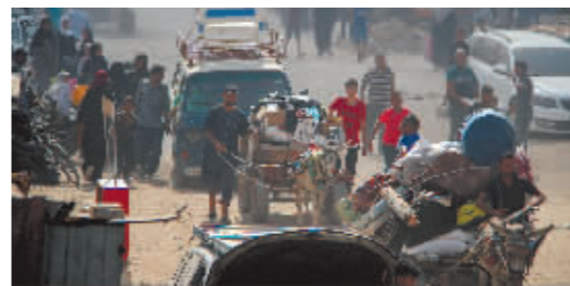
▲在加沙地带汗尤尼斯,巴勒斯坦人被迫按照以军要求离开该地区。