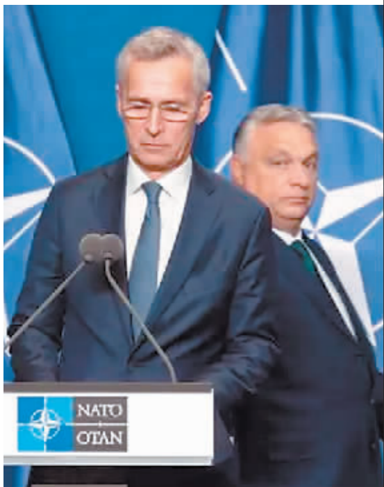
6月12日,在匈牙利布达佩斯,北约秘书长斯托尔滕贝格(前)与匈牙利总理欧尔班出席联合记者招待会。

“黯淡”“焦虑”“没什么值得庆祝”……北大西洋公约组织成立75周年峰会9日在美国华盛顿开幕,国外媒体给这次峰会贴上这些氛围标签。