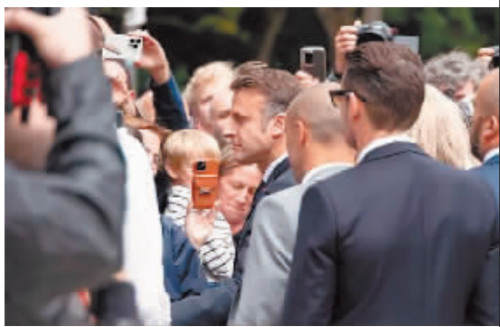
7月7日,在法国勒图凯,法国总统马克龙在投票后与民众交流。