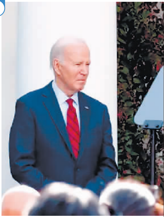
在美国华盛顿白宫拍摄美国总统拜登。