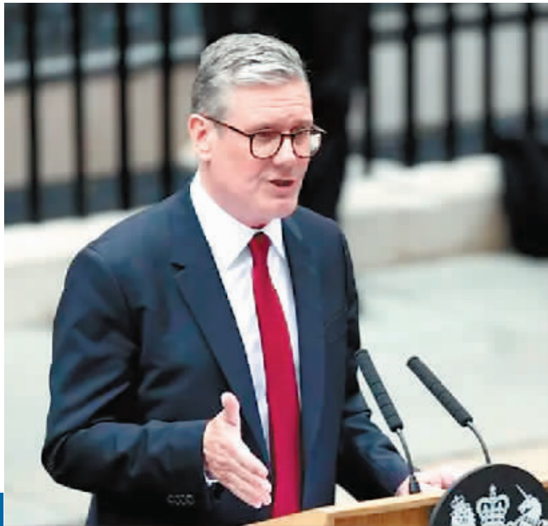
7月5日,基尔·斯塔默在英国伦敦唐宁街10号首相府前发表讲话。

借着选民不满英国经济不振、公共服务危机、非法移民增加等问题,工党击败保守党赢得议会下院选举,新首相斯塔默5日正式上任。