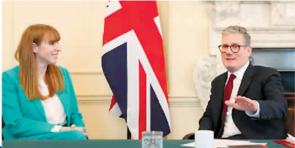
在首相府,首相基尔·斯塔默(右)与副首相兼地方发展、住房与社区大臣安杰拉·雷纳交谈。

不到一周,英国新政府就在内政外交层面开展了一系列紧锣密鼓的操作,在促进经济增长方面宣布改革方案、废除非法移民遣送的“卢旺达计划”、外交方面重拾“亲欧”路线,无不显示出求变之心。斯塔默上任的“三把火”能给英国带来什么改变?