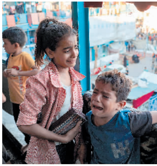
7月6日在加沙地带中部努赛赖特难民营遭以色列军队空袭的一所拍摄的孩子。