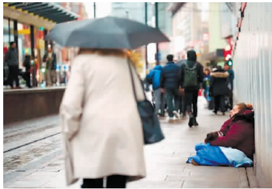
在英国曼彻斯特,一名乞讨者坐在路边。

但观察人士认为,通过打击犯罪来解决非法移民问题可能耗时较长,此外与欧洲国家联手或面临和法国等国的意见分歧。