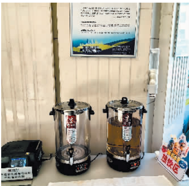
中行兆麟支行为游客准备的热茶和零食。

“我们准备利用这栋历史建筑的外形特征,为前来打卡的游客提供专门的盖章服务,让更多的游客了解这栋楼的历史以及发展情况。”农行哈分行相关负责人介绍说。