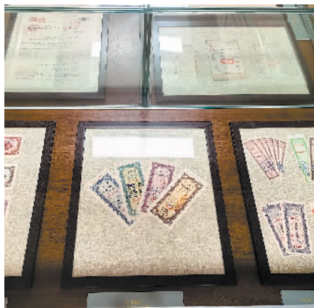
工行田地支行展出的中国人民银行首期有奖储蓄存单。