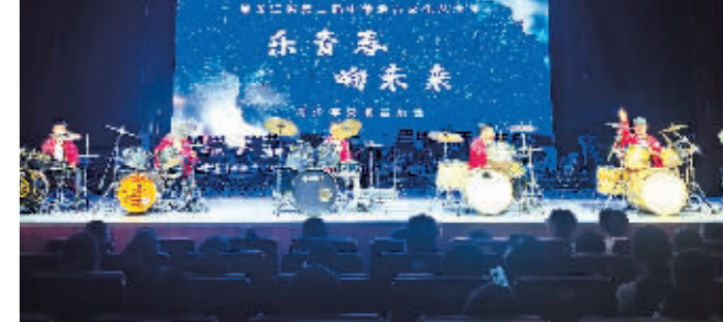
小乐手们在台上倾情演奏。

本报讯(记者 于秋莹/摄)挥洒青春的活力,放飞希望和梦想。7月7日晚,《乐青春 响未来》青少年交响音乐会在黑龙江省歌舞剧院音乐厅上演,黑龙江省歌舞剧院附属青少年交响管乐团担任演奏,特邀黑龙江省歌舞剧院舞蹈培训中心舞蹈团、哈尔滨新区师范附属小学校七彩童声合唱团重磅加盟,17首精彩的曲目,给现场观众带来视听盛宴。