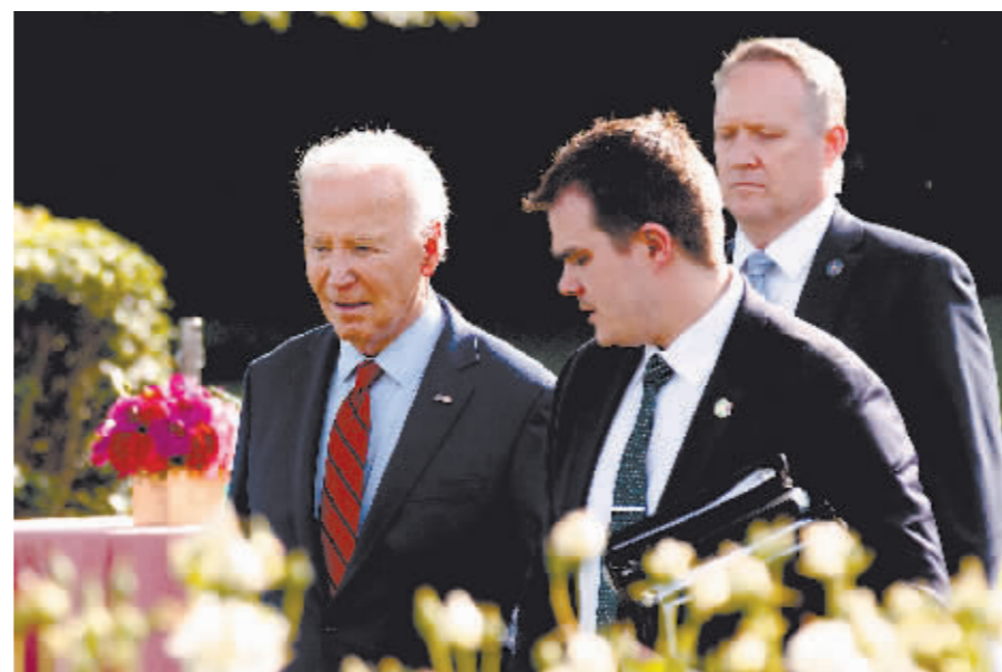
5月13日在美国华盛顿白宫拍摄美国总统拜登(左一)。

“接下来72到96小时内可能发生很多变化……对现今政坛而言,4个月很长。假如总统另择他路,我不担心我们能否推出一名优秀的候选人。”格林说。他认为,拜登如