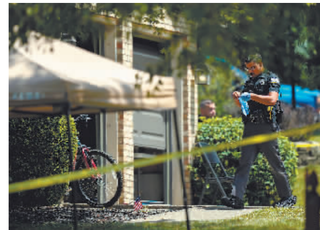
7月6日,警察在美国肯塔基州弗洛伦斯市枪击事件现场工作。

新华社华盛顿7月6日电 美国肯塔基州弗洛伦斯市警方6日说,该市一处私人住宅当天凌晨举行生日派对时发生枪击事件,造成4人死亡、3人受伤。嫌疑人随后自杀身亡。