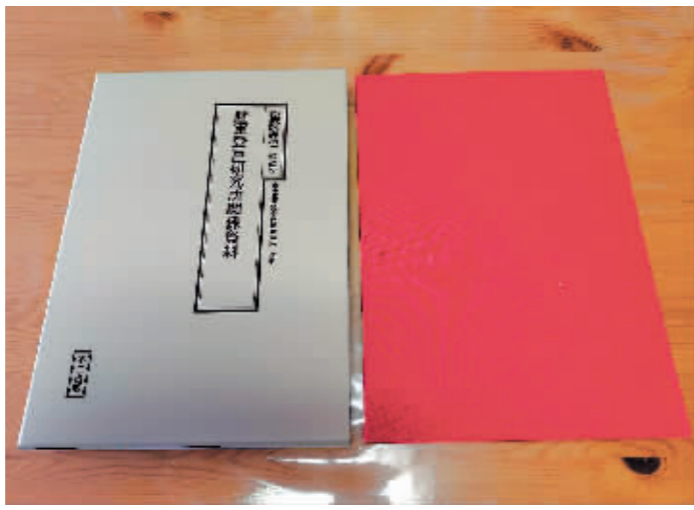
这是日本历史学者松野诚也的新书《陆军登户研究所相关资料》。

登户研究所又名第九陆军技术研究部,其前身是陆军科学研究所。该机构是日军在二战期间进行“秘密战”研究的重要机构,主要研究如何进行间谍及暗杀活动、如何伪造法定货币、如何制作气球炸弹等。