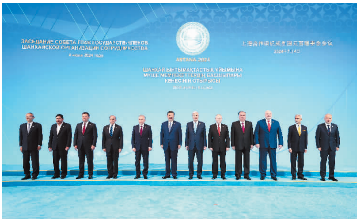
当地时间7月4日上午,国家主席习近平在阿斯塔纳独立宫出席上海合作组织成员国元首理事会第二十四次会议。