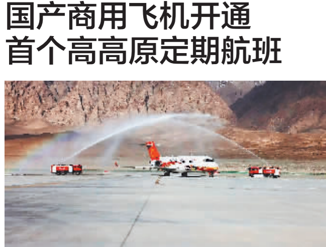
国产支线客机ARJ21抵达塔什库尔干塔吉克自治县红其拉甫机场。

据新华社电 记者从中国商飞公司了解到,7月2日,国产支线客机ARJ21从新疆喀什徂徕国际机场起飞前往塔什库尔干塔吉克自治县红其拉甫机场,标志着ARJ21飞机首条高高原航线“喀什—塔什库尔干”成功开航。这是国产商用飞机开通的首个高高原定期航班,我国高高原航线上第一次有了国产商用飞机的身影。