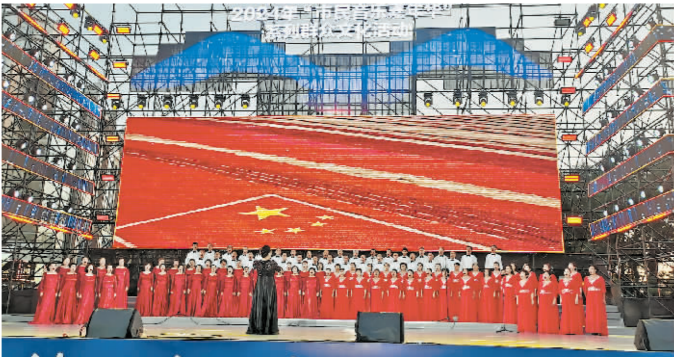
文艺专场演出现场。

当《谁不说俺家乡好》《唱支山歌给党听》等耳熟能详的歌曲响起,台下的观众不由自主地跟着哼唱起来,台上台下歌声交融成一片,广场成为赞歌的海洋。大合唱《十送红军》《哈尔滨的歌》将整场演出推向高潮。市民游客纷纷拿出手机,抓拍精彩的演出瞬间。