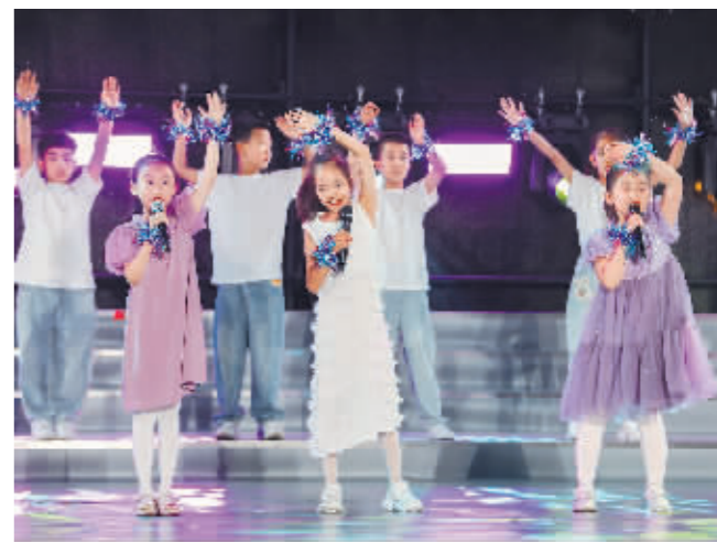
孩子献上饱含深情的朗诵。

本报讯(记者 于秋莹/文)为突出“龙年游龙江·冰城夏都风光”主题,全面擦亮哈尔滨国家历史文化名城、音乐之城、奥运冠军之城、中国西餐之都、中国啤酒之都、避暑旅游优选地等城市名片,高质量打造超长“避暑季”和“音乐季”,6月30日,“市民音乐嘉年华”系列文化活动迎来“庆七一 颂党恩”哈尔滨市朗诵协会专场文艺演出,来自冰城各行各业的朗诵爱好者齐聚防洪纪念塔广场,通过朗诵与唱歌、舞蹈、模特秀相结合的艺术形式,共同庆祝中国共产党成立103周年。