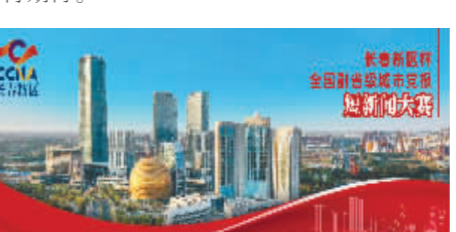
木兰松花江公路大桥上“灯廊”明亮。

起来,暖起来,既提升了百姓的获得感、幸福感、安全感,也诠释了木兰县委、县政府积极主动求发展的态度和决心,小城的未来更值得期待。