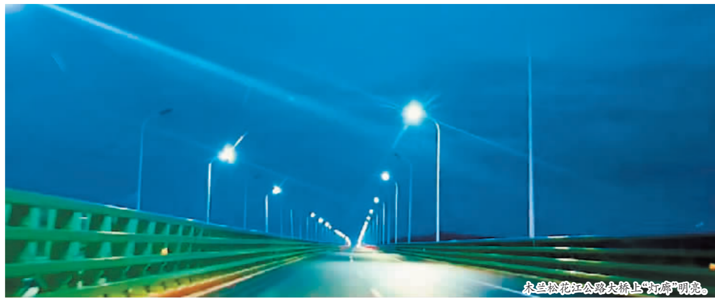
木兰松花江公路大桥上“灯廊”明亮。

木兰县有“六山一水一草二分田”的自然地貌。多年前,因地域条件制约,木兰县无铁路、无高速公路,不仅影响了发展,缺少招商引资魅力,是省级贫困县。经过木兰县各界齐心协力谋发展、小城掀开了历史新篇章。特别是“感动中国”的马旭老人,凭借自己的大爱付出,帮家乡扬名全国。如今,马旭文博艺术中心成为木兰最亮眼的地标建筑、城市会客厅,“红色鸡冠山”成为旅游打卡地,木兰县也把“乡友招商”作为招商工作的一个重要方向,持续发力。在马旭精神的感召下,越来越多的木兰游子“组团”回家乡投资置业,木兰县逐渐驶入经济发展快车道。