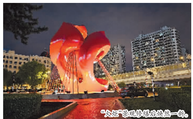
“火炬”景观修缮后焕然一新。

本报讯红红的火炬造型,在夜色中打上灯光,很快成为一道风景线。日前,香坊区城管部门完成位于乐松广场上名为“火炬”和“源”的两座大型景观造型的修缮和养护。