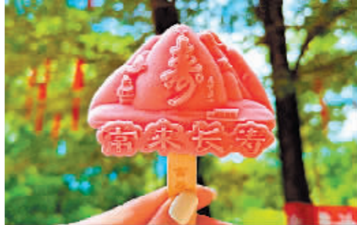
造型别致的“寿”文创雪糕。