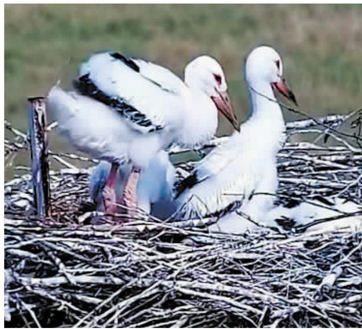
好生态引来东方白鹤筑巢安家。