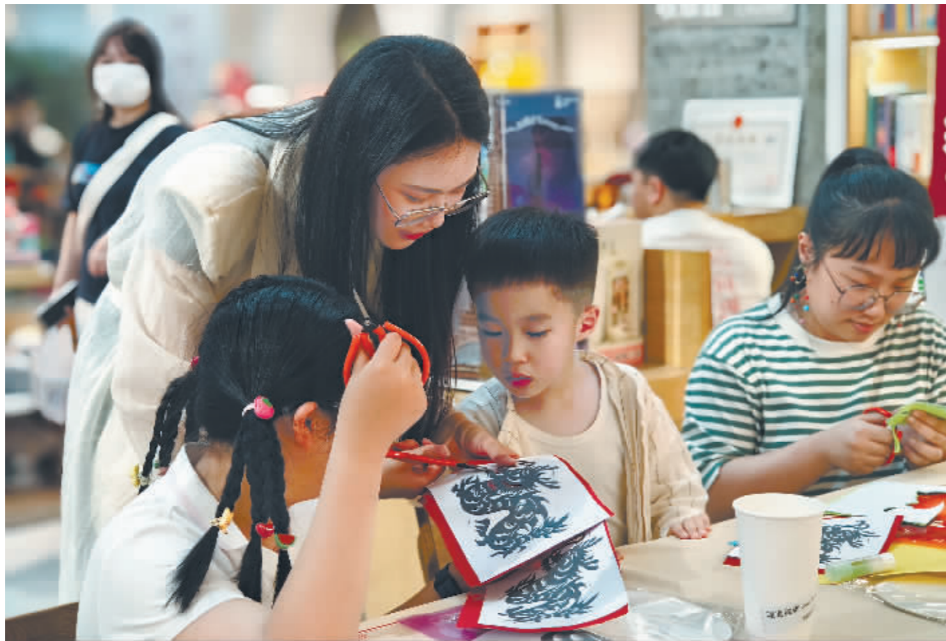
体验非遗剪纸的魅力。

本次活动由省文化和旅游厅、市文化广电和旅游局和哈尔滨文化产业协会主办,活动旨在中央大街上创立一个独一无二的非遗文化专区,弘扬黑龙江省珍贵的非遗文化和非遗产品,定期邀请非遗传承人现场进行签售、教学体验等,增加非遗文化的体验性和互动交流性。