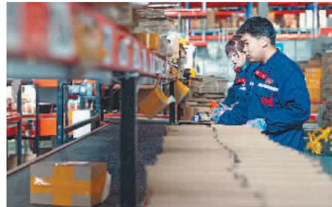
在中国(黑龙江)自由贸易试验区黑河片区,电商园区的工人把货物通过传送带送到快递分拣场。

新华社北京6月17日电 国家邮政局17日发布5月份邮政行业运行情况。数据显示,今年前5个月,快递市场呈现出稳中有进、稳中向好的特点,月均业务量超130亿件,特别是5月份,快递业务量完成147.8亿件,继今年1月创造单月快递业务量历史新高后,再次刷新月度业务量纪录。