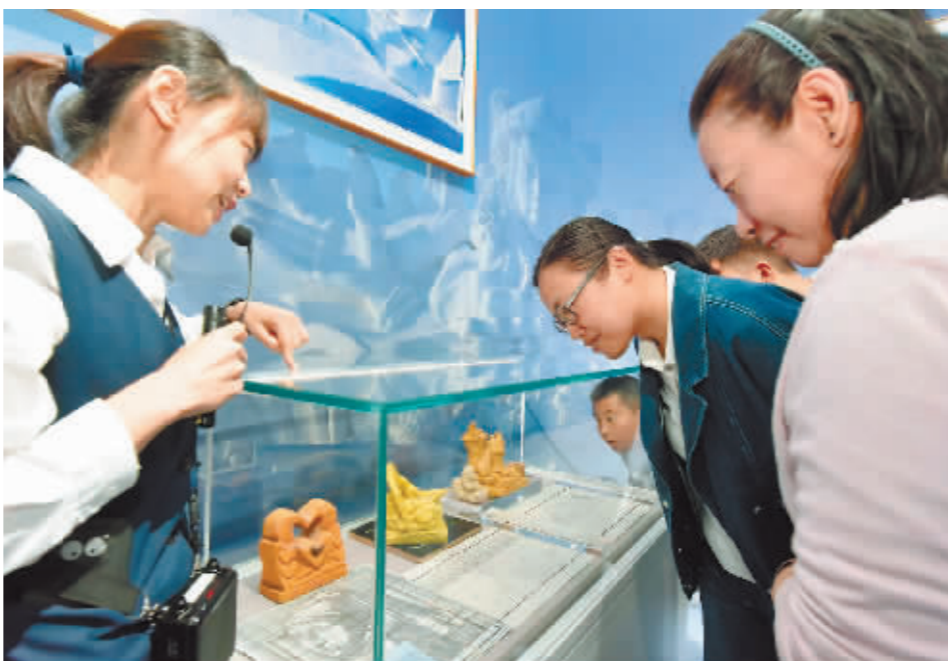
获奖人员参观哈尔滨冰雪文化博物馆。

距离2025年第九届亚冬会开幕仅有200余天,哈尔滨进入了亚冬时间。未来,哈尔滨日报社将继续和哈尔滨冰雪文化博物馆深度合作,共同推广哈尔滨冰雪文化,助力亚冬盛会。