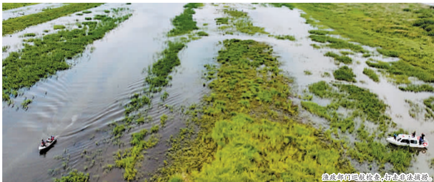
渔政部门巡航检查,打击非法捕捞。

本报讯年初以来,哈尔滨市通过一系列强有力的措施,持续强化渔政执法,坚决打击非法捕捞行为,保护水生生态资源。在禁渔期,相关部门统筹部署,采取多种手段,形成高压态势,有效遏制非法捕捞现象。13日,记者从哈尔滨市农业农村局渔业渔政管理处获悉,截至目前,已查办涉渔行政违法案件16起、涉渔刑事违法案件33起。