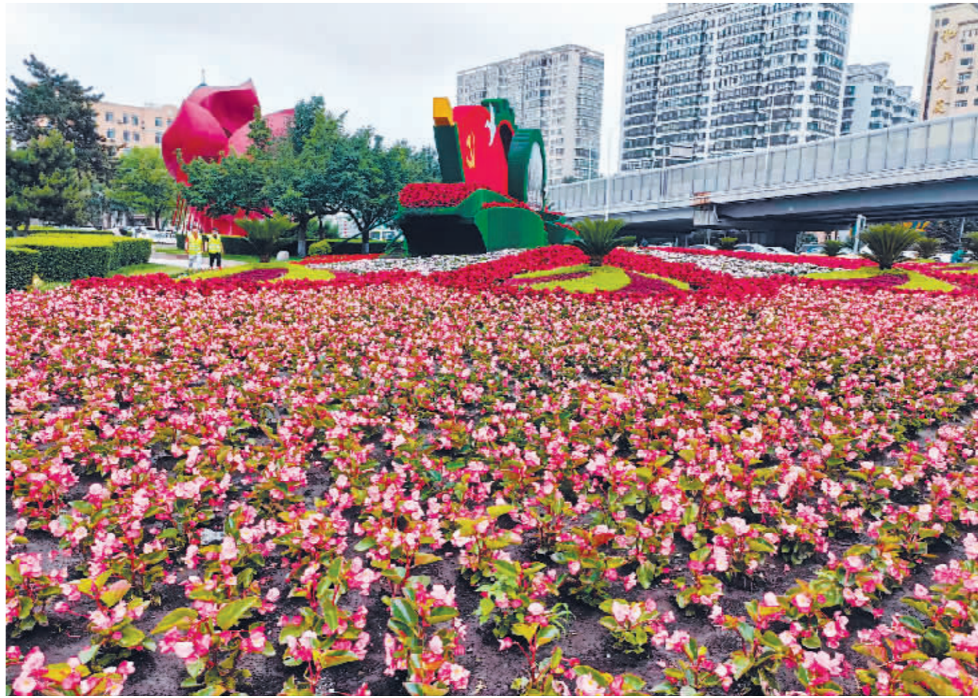
“雀屏”主题花坛前姹紫嫣红的花海。

据市城管局园林中心相关负责人介绍,我市彩化形式主要有平面彩化和立体彩化两种,包括五色草立体花坛和垂直彩化。全市彩化花卉主要为大花海棠、龙翅海棠、美人蕉、马鞭草等70余个一、二年生草本,多年生宿根、藤本、木本等植物,彩化从色彩、构图和植物材料应用上,充分展现出中西合璧