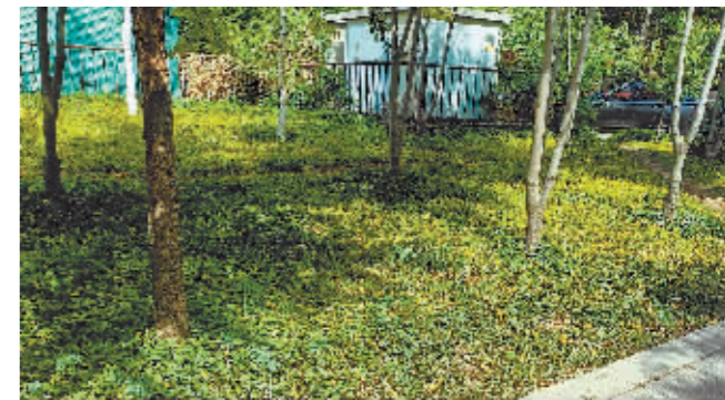
碧绿的委陵菜能有效解决林下裸土难题。

本报讯(记者 霍亮文/摄)碧绿的枝叶铺满地面,金黄色的花朵随风摇曳……如今,哈尔滨市街头绿地中随处可见郁郁葱葱的绿植。很多市民以为这是一种野草,其实是委陵菜,能有效治理林下裸土难题。