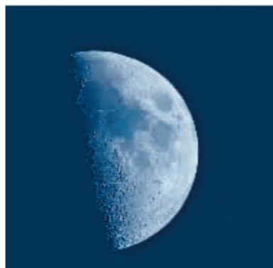
星空摄影爱好者2024年3月17日在北京丰台区拍摄的一轮上弦月。

“不论是年度最小上弦月还是最大下弦月，肉眼看上去，与其他月份的弦月区别不大。感兴趣的公众可尝试将本月的最大和最小弦月用相同的拍摄参数拍下来，然后进行拼合对比，会很有趣。”杨婧说。