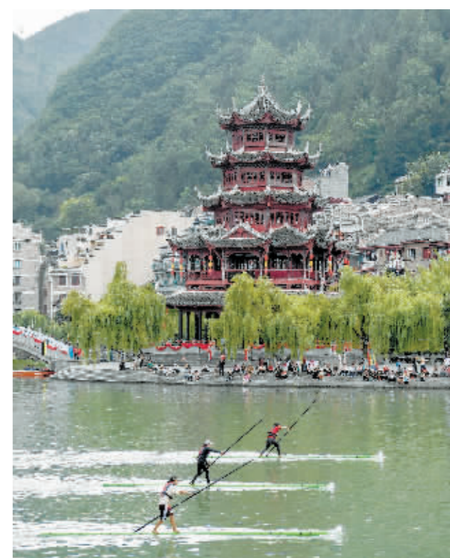
6月11日，参赛队员进行独竹漂比赛。

6月10日至12日，2024年民体杯全国龙舟、独竹漂比赛在贵州省镇远县举行。来自河北、云南、贵州、上海、广西、西藏、湖北的7支独竹漂队伍参加比赛，在青山绿水间比拼独竹漂。