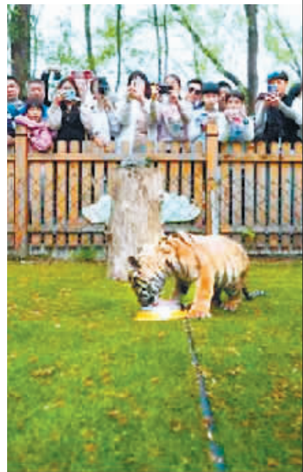
小东北虎吃“肉粽子”，游客们纷纷拍照。