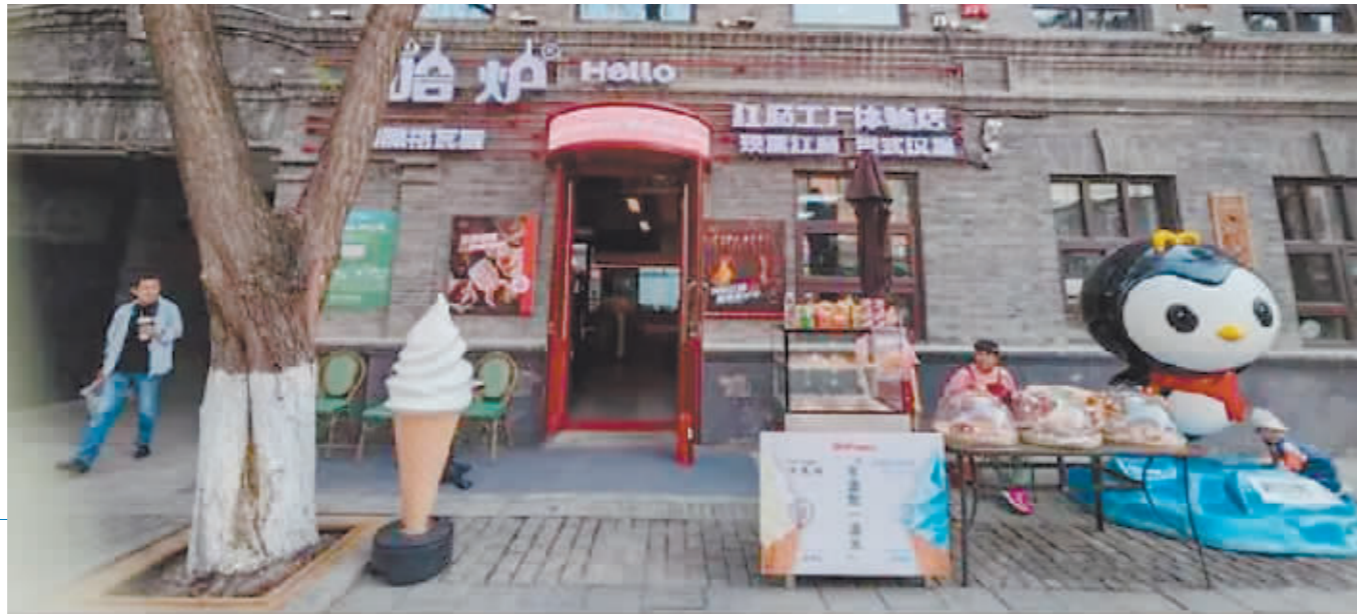
中华巴洛克历史文化街区一景。

经大数据测算，端午假日期间，全市共计接待游客263.67万人次，同比增长17.5%，其中省外游客38.04万人次，省内游客225.63万人次，分别同比增长44.75%、13.89%。旅游总花费为25.57亿元，同比增长24.25%。