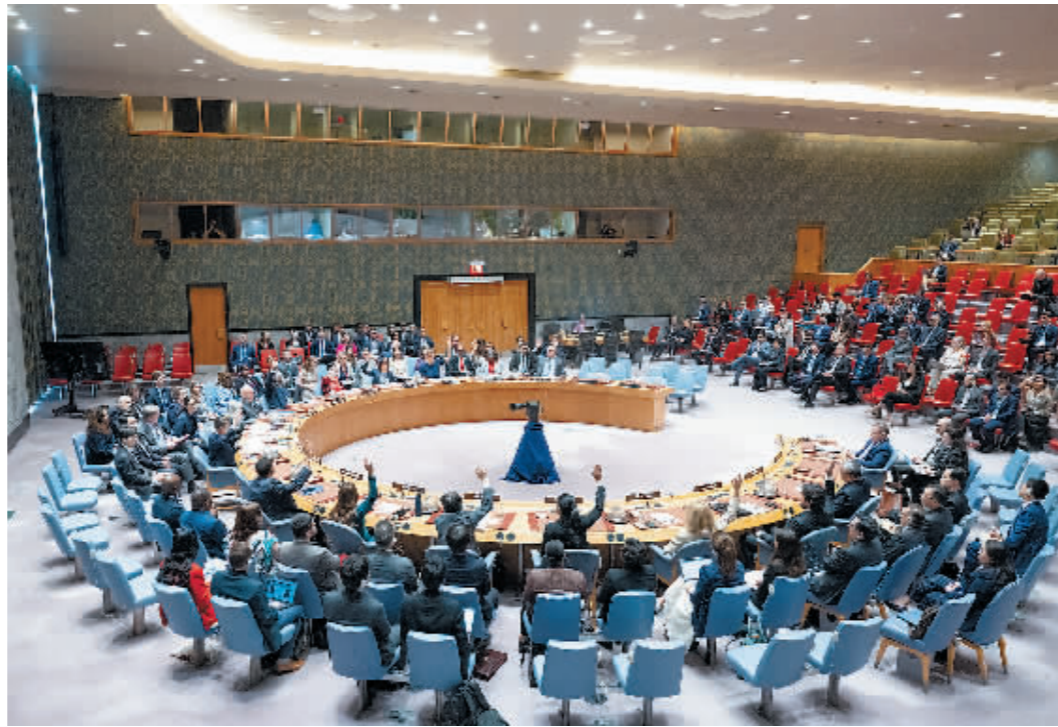
6月10日,在位于纽约的联合国总部,联合国安理会就呼吁在加沙地带实现停火的决议草案投票。

哈马斯10日也发表声明对安理会通过决议表示欢迎,并表示愿意与调解方合作,就执行符合加沙人民和哈马斯要求的原则进行间接谈判。