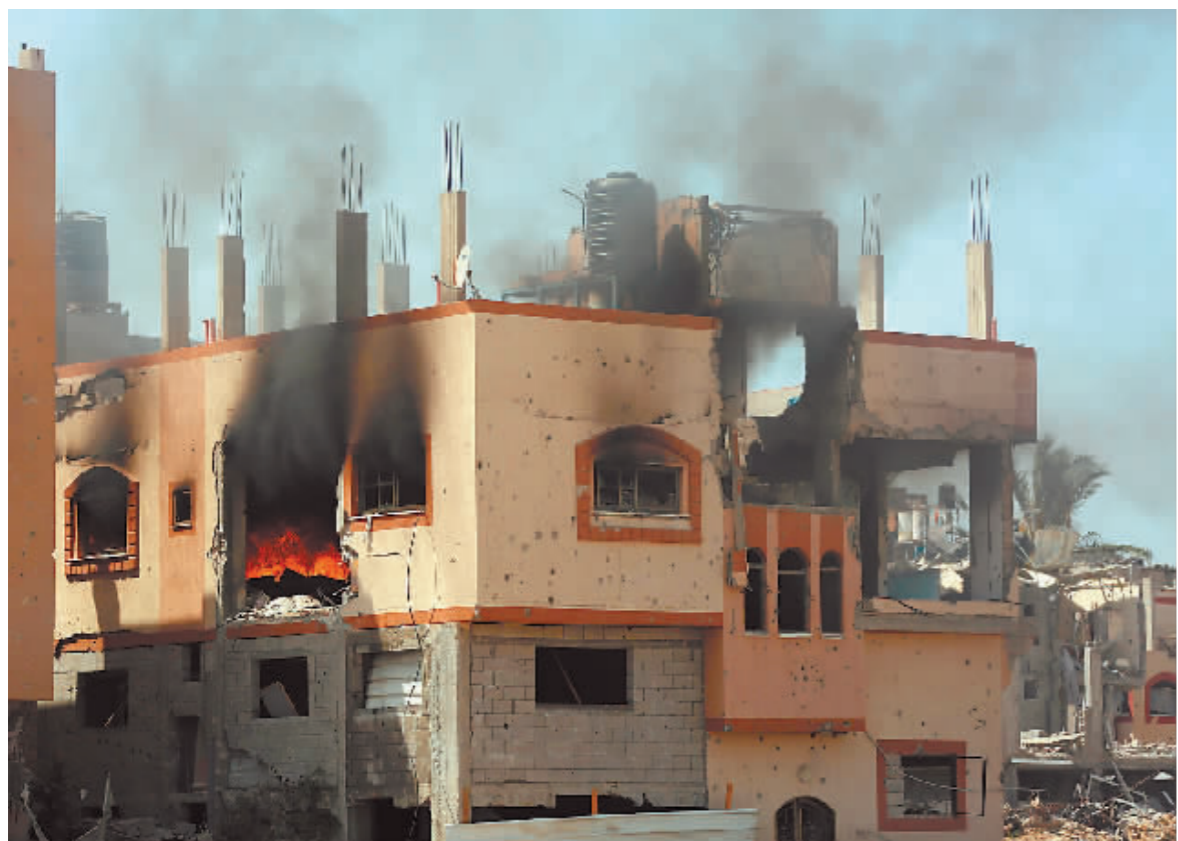
6月8日在加沙地带中部努赛赖特难民营拍摄的在以军袭击中受损严重的房屋。

以方被扣押人员中,约100人于去年11月冲突双方短暂停火期间获释。以色列总理府说,眼下仍有116名被扣押人员尚未获救,其中至少41人已死亡。