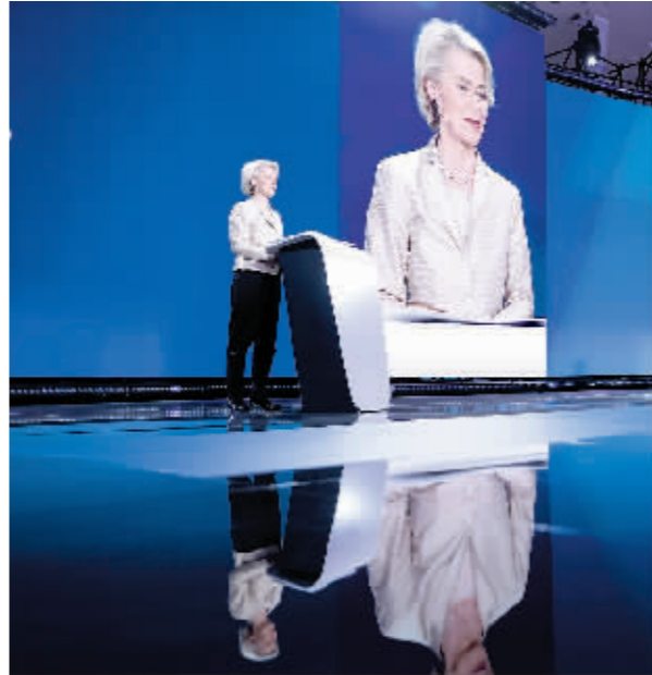
6月9日,在比利时布鲁塞尔,欧洲人民党党团“领衔候选人”冯德莱恩在欧洲议会发表演讲。