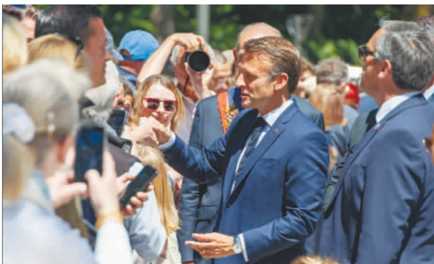
6月9日,在法国勒图凯市一处投票站外,法国总统马克龙(右二)在参加欧洲议会选举投票前与民众交流。

作为欧盟最大经济体,德国在欧洲议会拥有96个议席,第二大法国有81席。同样失意的是比利时首相亚历山大·德克罗。他9日晚含泪宣布辞职,成为看守首相。他领导的荷语开放自民党