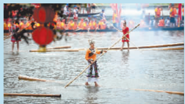
“五月五·龙船鼓”10日在广州荔湾湖公园举行,这是活动中的非遗项目独竹漂表演。