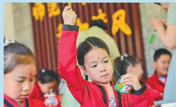
小朋友在山东省青州市范公亭公园非遗传习讲堂开展的体验活动中缝制香囊。