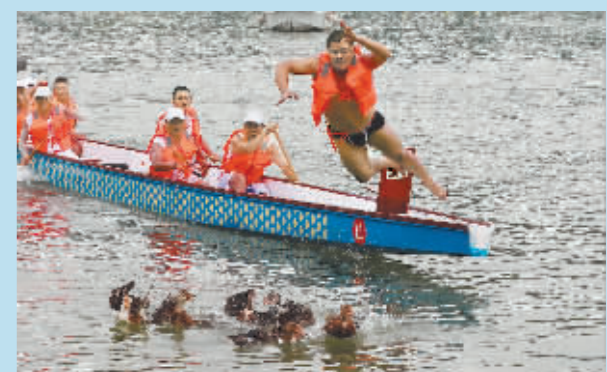
四川省广安市武胜县龙舟队员参加趣味抢鸭活动。