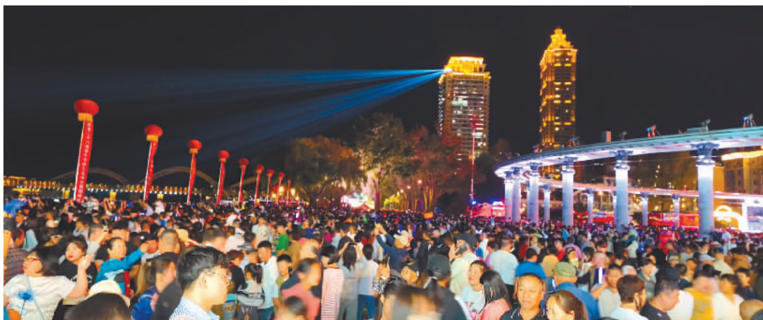
6月9日晚,防洪纪念塔广场上踏青的人群。

畔的防洪纪念塔广场,只为掬一捧沁凉的江水,感知夏天的来临。监测数据显示,9日17时40分,中央大街人流量达到峰值。