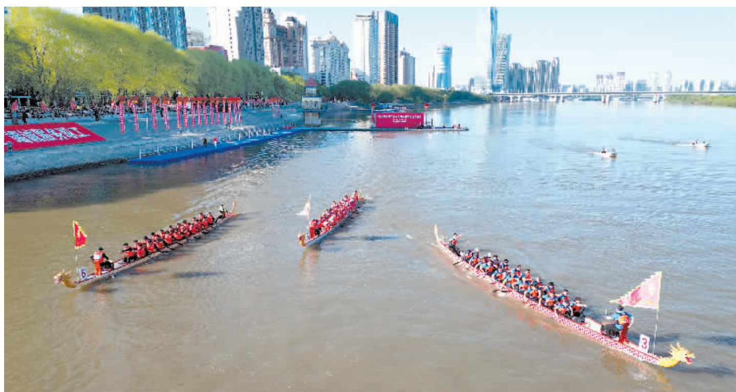
一声令下三艘龙舟冲出发点。

经过激烈角逐,哈尔滨电机厂有限责任公司代表队夺得冠军,东北轻合金有限责任公司代表队获得亚军,黑龙江隆安物业集团有限公司代表队获得第三名。哈尔滨工业大学、张亮企业管理(集团)有限公司等8个单位获优秀组织奖。