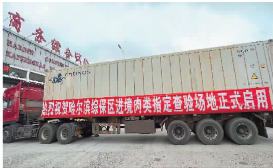
俄罗斯进口牛肉运抵哈尔滨综保区。

成功将肉类跨境冷链物流通道延伸至莫斯科,进一步提高了我省、我市的对俄贸易货物运输组织能力。冷链班列从莫斯科发车,终到哈尔滨综保区,实现了长距离、高效率铁路运输。同时,将俄罗斯优质肉类产品供给与国内消费需求有效对接,实现了对俄罗斯货物贸易、跨境物流运输、国内终端消费市场的全面链接,有效发挥了哈尔滨综保区进境肉类指定监管场地的功能枢纽作用。不仅为我省、我市绿色食品加工产业发展创造了新的机遇,也为哈尔滨综保区推动俄罗斯进口肉类贸易从物流运输向产业聚集转变,将开放优势加速转化为发展动力,做好通道带物流、物流带经贸、经贸带产业大文章奠定了基础。