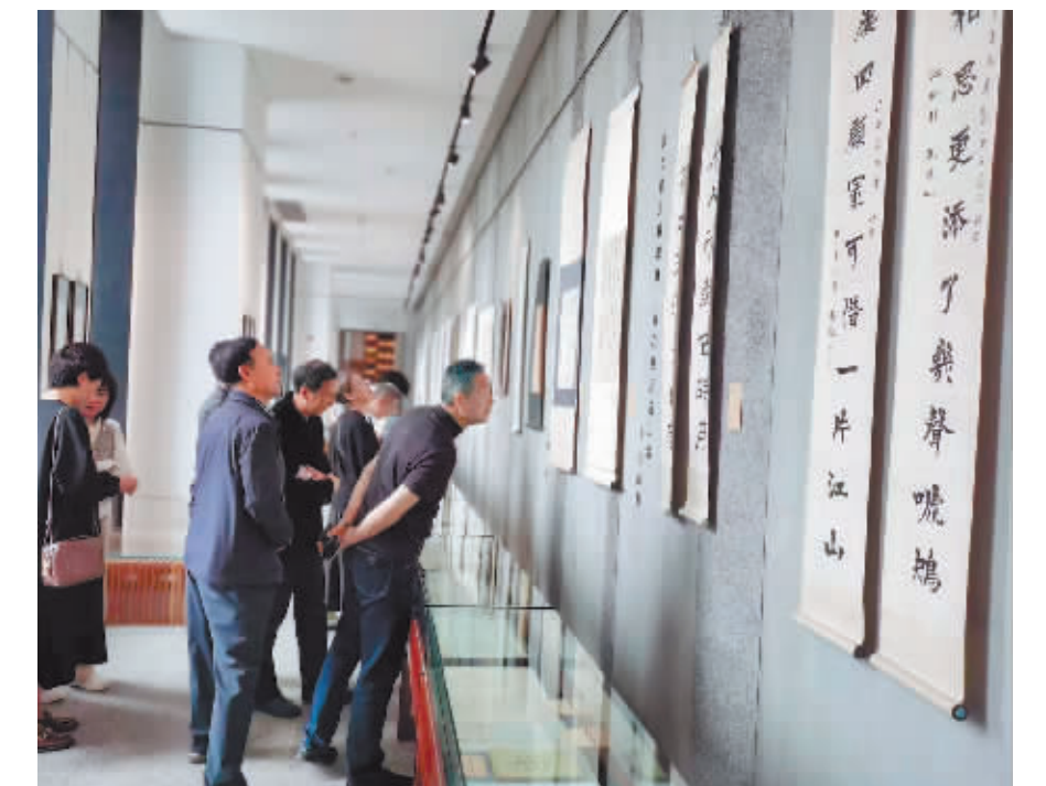
市民在美术馆参观。

厅,细细审视展品,予以高度赞扬。“来到萧红与新文化名人手迹展现场,仿佛一个文化时代扑面而来。通过对这些手迹展或中国历史上一些文化名人的书法的欣赏,可以提升我们的文化修养,对我们理解人生,理解人和时代、人和人的关系都有很有益的促进。希望这样的展览能可持续地、经常地在这里或者那里展出,让更多人能够了解文化遗产的魅力。”梁晓声说。