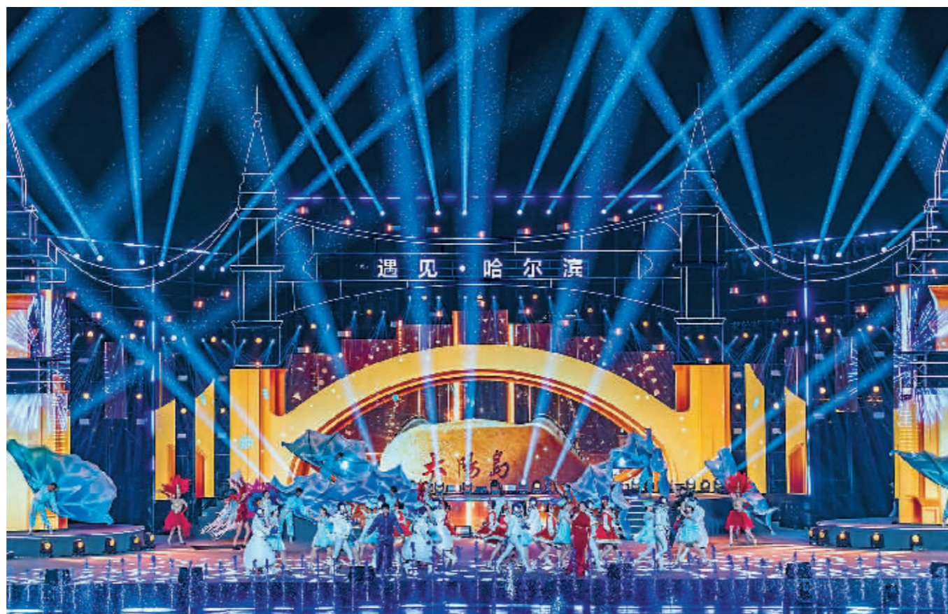
「遇见·哈尔滨」彩排现场。