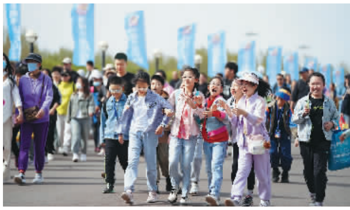
5月2日,游客在太阳岛国家级风景名胜区游览。 新华社发