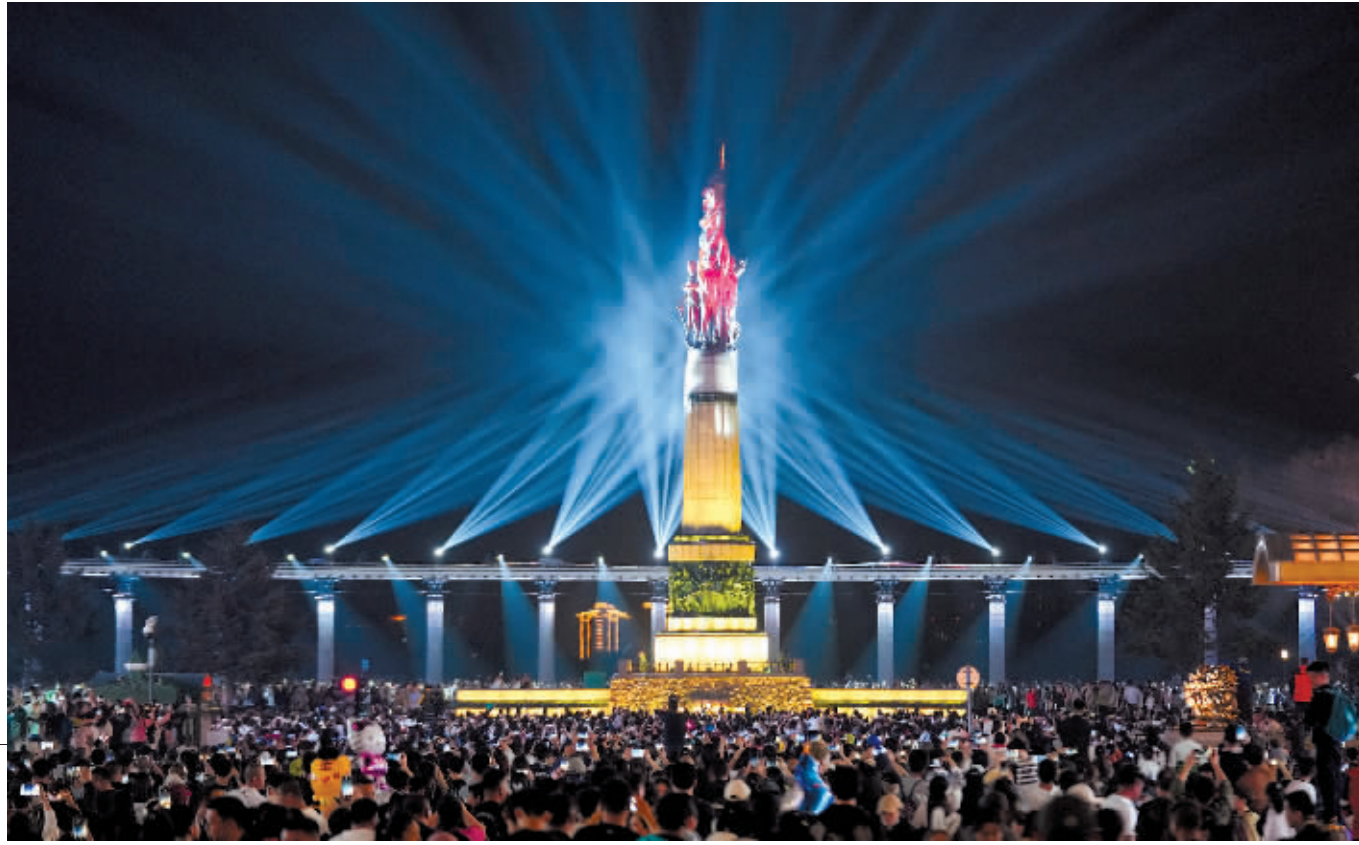
5月2日,游客在太阳岛国家级风景名胜区游览。