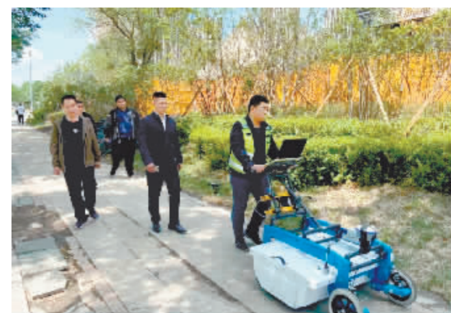
工作人员利用地探雷达设备进行探测。

本报讯(记者 刘希阳)地下管线是否有故障?路面夹层是否有脱落现象?利用地探雷达设备,可以提早发现问题。近日,黑龙江交投集团养护科技公司哈尔滨分公司在市政工程项目中首次应用新设备,为即将开展的给排水改造工程提供科学依据和数据支持。