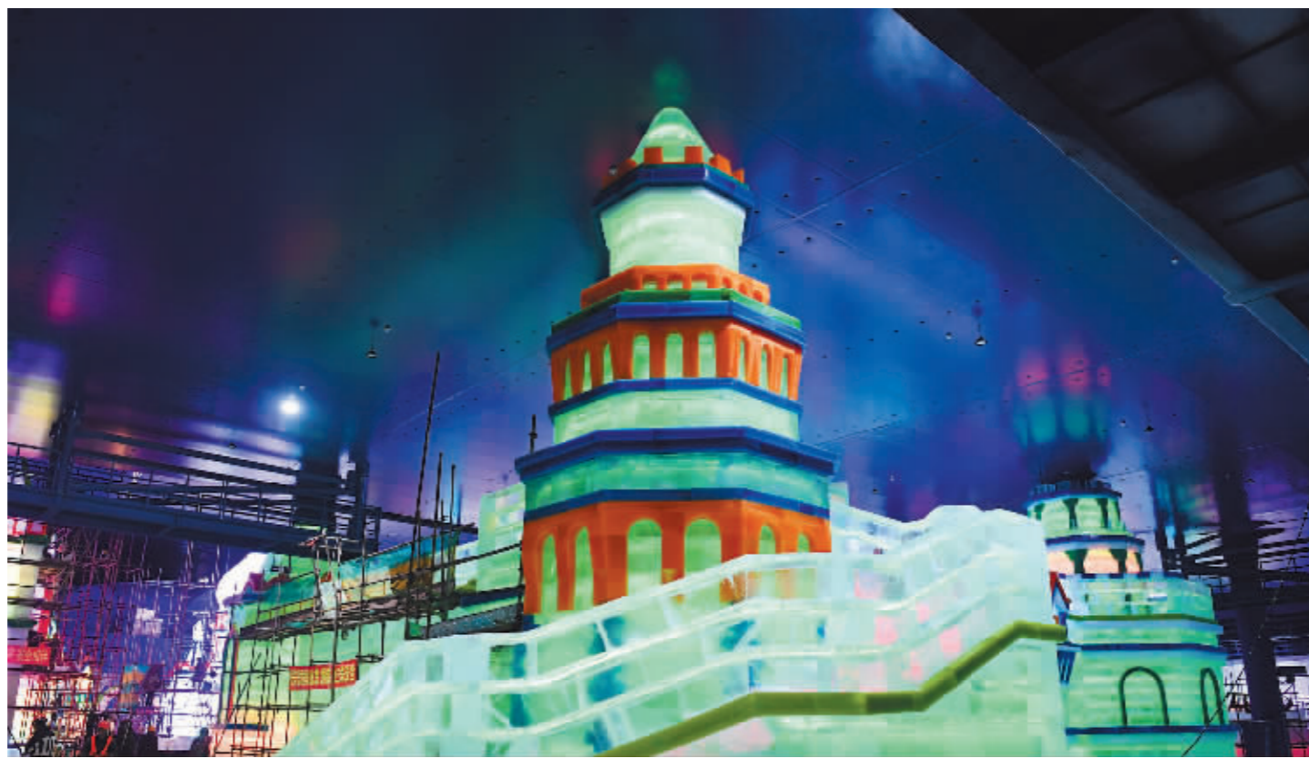
晶莹剔透的室内冰建筑。

景观氛围的美化,梦幻冰雪馆将如约于6月下旬和游客见面。届时,哈尔滨冰雪大世界的四季冰雪项目,包括梦幻冰雪馆、四季游