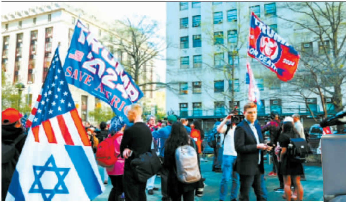
4月15日,特朗普的支持者在法庭前的公园举行集会。

特朗普不仅是美国前总统,而且已经锁定今年美国总统选举共和党总统候选人提名。美国媒体和专家认为,此案或为下一场“国会山骚乱”埋下祸根,将今年的总统选举乃至整个美国推入“未知领域”。