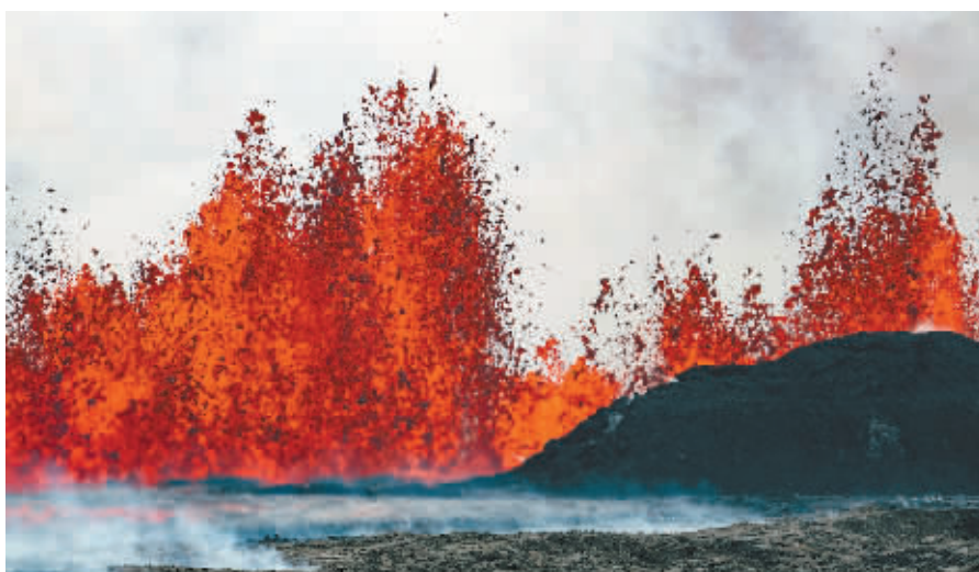
位于冰岛西南部的雷恰角半岛29日下午发生火山喷发,喷发的岩浆一度高达50米,初始裂缝长度约为1公里,并仍在不断增长。