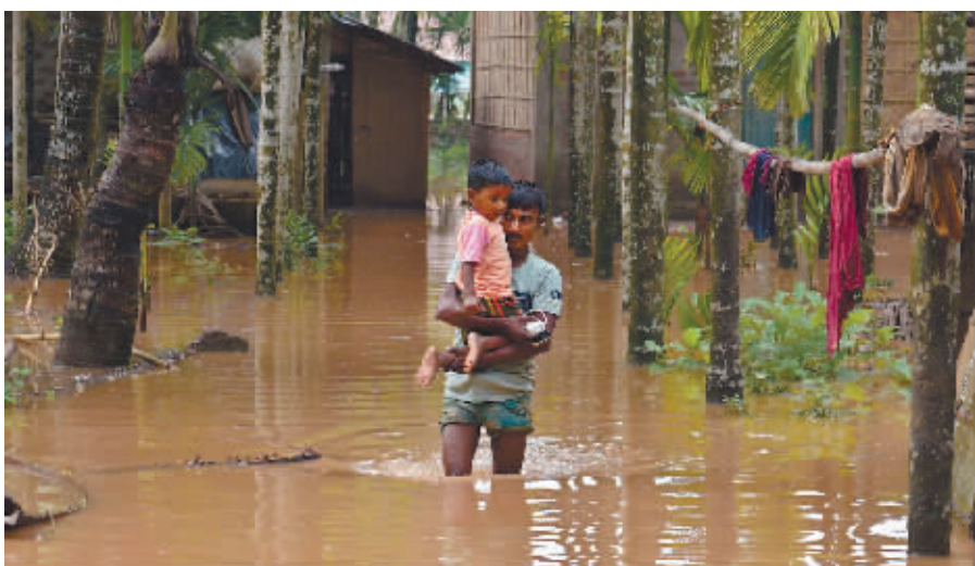
5月29日,在印度东北部阿萨姆邦,一名男子抱着孩子走在洪水中。受热带气旋“雷马尔”引发的强降雨影响,印度东北部多地洪水泛滥。