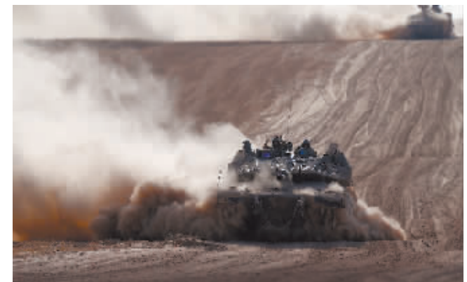
5月29日在以色列与加沙边境以方一侧拍摄的以军部队。

据新华社电 以色列军方发言人哈加里29日晚发表声明说,以军对加沙地带与埃及边界的“费城走廊”实现“完全作战控制”,以色列国家安全顾问察希·哈内格比称,在巴勒斯坦加沙地带的战事还将持续至少7个月。