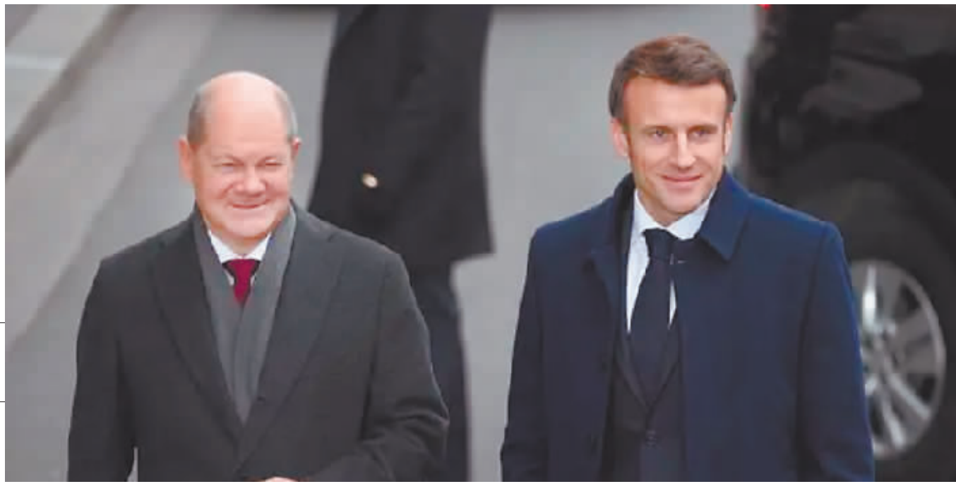
法国总统马克龙(右)和德国总理朔尔茨。

法国总统马克龙对德国的国事访问日前已结束,这是24年来法国总统首次对德国进行国事访问。分析人士指出,此访正值乌克兰危机久拖不决、欧洲议会选举在即之际,法德希望通过马克龙此访弥合两国在欧洲防务等问题上的分歧,共同应对不断壮大的欧洲极右翼势力。