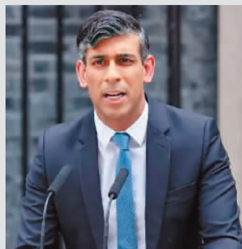
5月22日,英国首相苏纳克在伦敦唐宁街10号首相府前发表讲话。

据新华社电 英国议会下院30日正式解散,为拟于7月4日提前举行的议会选举作程序准备。