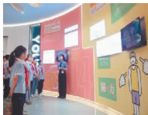
学生们在未成年人法治教育基地了解防校园欺凌的法律知识。

“问题少年”,何以为策?最高人民法院30日发布关于全面加强未成年人司法保护及犯罪防治工作的意见,意见明确,对未成年人犯罪宽容不纵容,标本兼治,惩防并举,教育引导未成年人遵纪守法。