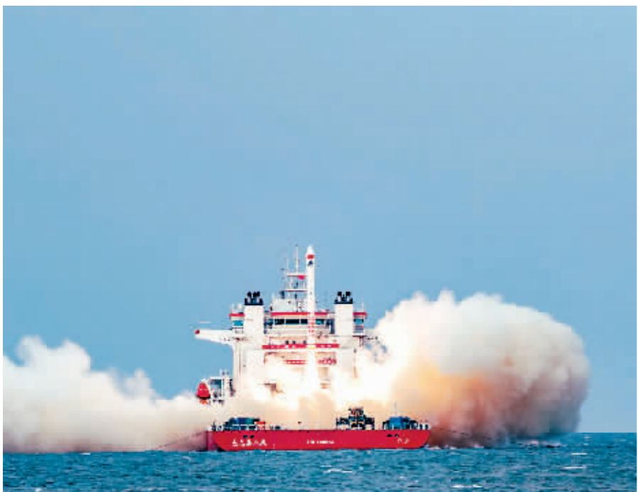
5月29日16时12分,我国太原卫星发射中心在山东附近海域成功发射谷神星一号海射型遥二运载火箭,搭载发射的天启星座25星-28星顺利进入预定轨道,飞行试验任务获得圆满成功。