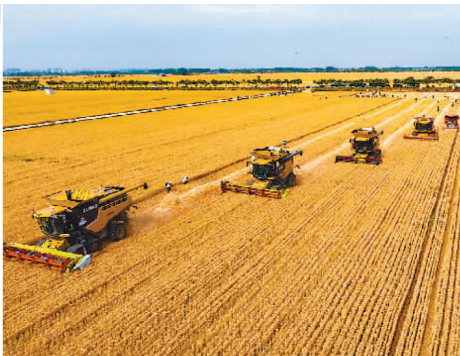
5月29日,机收编队在河南省驻马店市西平县老王坡高标准农田收获小麦。夏收时节,各地小麦产区麦浪起伏,农机在麦田里穿梭,构成一幅幅美丽的丰收图画。