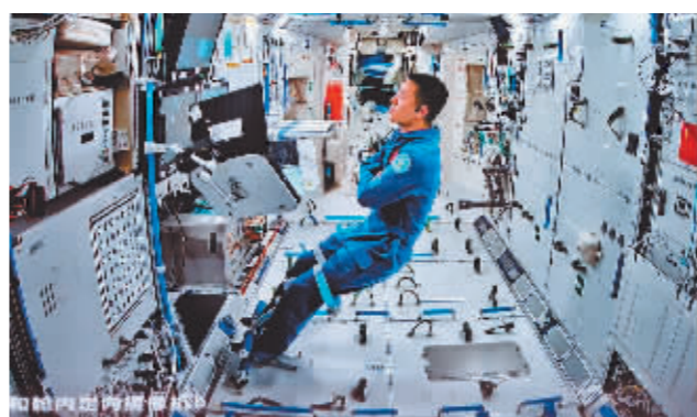
航天员李聪密切关注出舱任务的画面。

据中国载人航天工程办公室介绍,按计划,神舟十八号载人飞行任务期间还将开展多次航天员乘组出舱活动和应用载荷出舱任务。