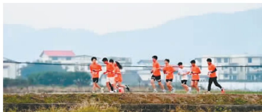
广西柳州市融安县“村跑”参赛选手在比赛中。

受马拉松赛事的启发,一些乡村策划出以跑步为载体,以特色村道为赛道的“村跑”赛事。通过跑步给美丽乡村引流,助力乡村全业态的发展。在江苏常熟等地的乡村,“村跑”用跑步串联起了美丽乡村风景线,已经成为小有名气的乡村IP。如今每到周末,爱好跑步的当地村民和从城里赶来的市民相聚“村跑”,在城乡间掀起全民健身的热潮。