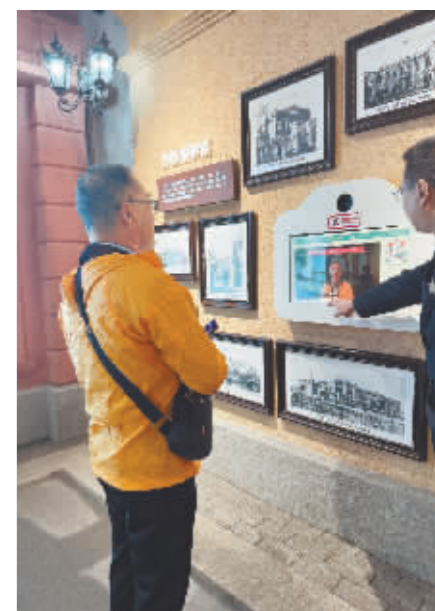
哈尔滨市博物馆人机互动体验。

“现在哈尔滨全市各个景点都在尝试通过多元化、沉浸式的科技元素提升传统文旅项目魅力。”哈尔滨市旅游协会副会长孙明说,这种科技加持的智慧旅游让传统文旅更有看点,也加速了文旅产品的发展步伐,为城市、投资机构和市场主体创造更多面向新需求的旅游空间和消费场景。