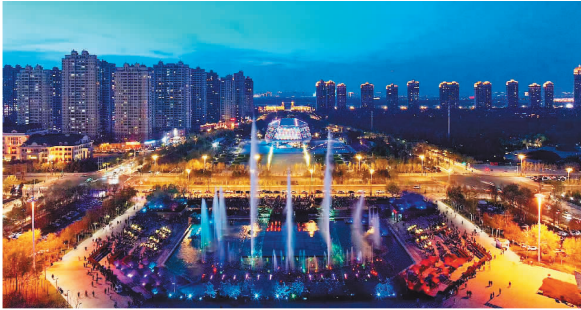
群力音乐谷喷泉上演炫目光影秀。

今年是智慧旅游元年。今年2月22日,文化和旅游部、国家发展改革委、工业和信息化部三部委联合公布“第一批全国智慧旅游沉浸式体验新空间培育试点项目名单”,首批入选项目共42个。由黑龙江省文化和旅游厅牵头推荐,哈尔滨冰雪大世界股份有限公司申报的“哈尔滨冰雪大世界冰雪光影互动智慧旅游沉浸式体验新空间”项目成功入选。今年“五一”假期,全国42家智慧旅游沉浸式体验新空间实现消费总额超过2.2亿元,吸引消费者430万人次。