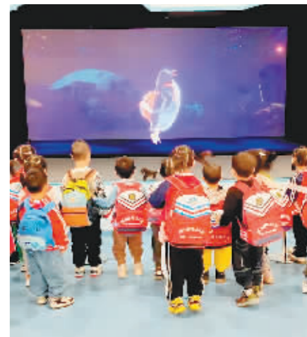
孩子们观看裸眼3D动漫《淘学走天下》。

志摩亲笔签名的第一辑《诗刊》等500余件历史文物原件,还有老式缝纫机、铜床、收音机、小提琴等当年实物。“我们还邀请了两位俄罗斯女孩,在展区中心还原生活现场拉小提琴,让参观者更直观地感受到当年中央大街的风情。”杨伟东说,此外,我们还复制了中央大街的铜马车塑像,这种全方位沉浸式体验目的就是让游客有身临其境的感觉。