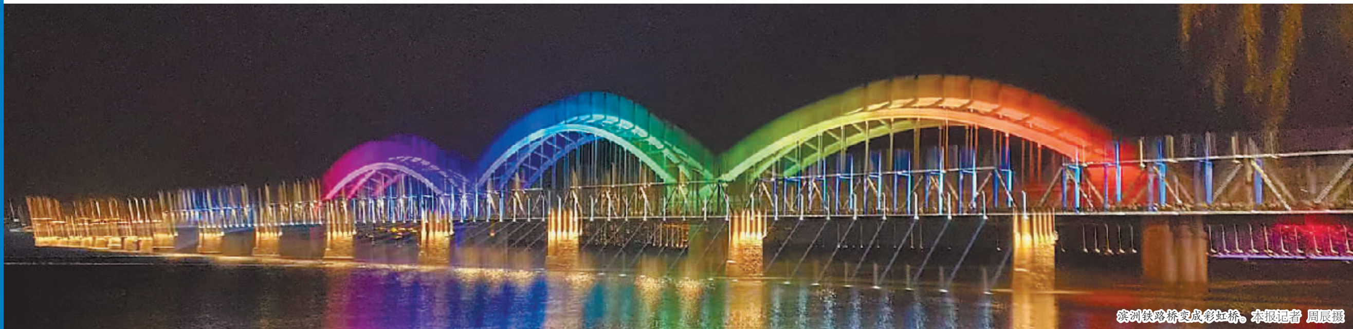
滨洲铁路桥变成彩虹桥。