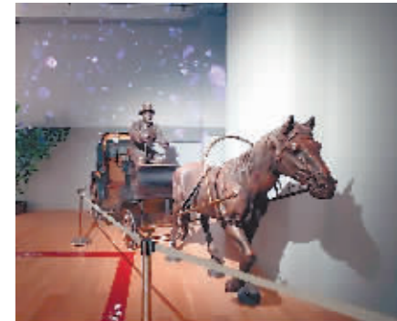
复制的中央大街铜马车塑像。

与此同时,南岗区文旅局计划设计一款历史建筑智能化地图,通过VR技术让建筑“说话”。通过现代媒体技术,让历史建筑的故事得以传承和传播,让更多人了解和关注这些珍贵的文化遗产。