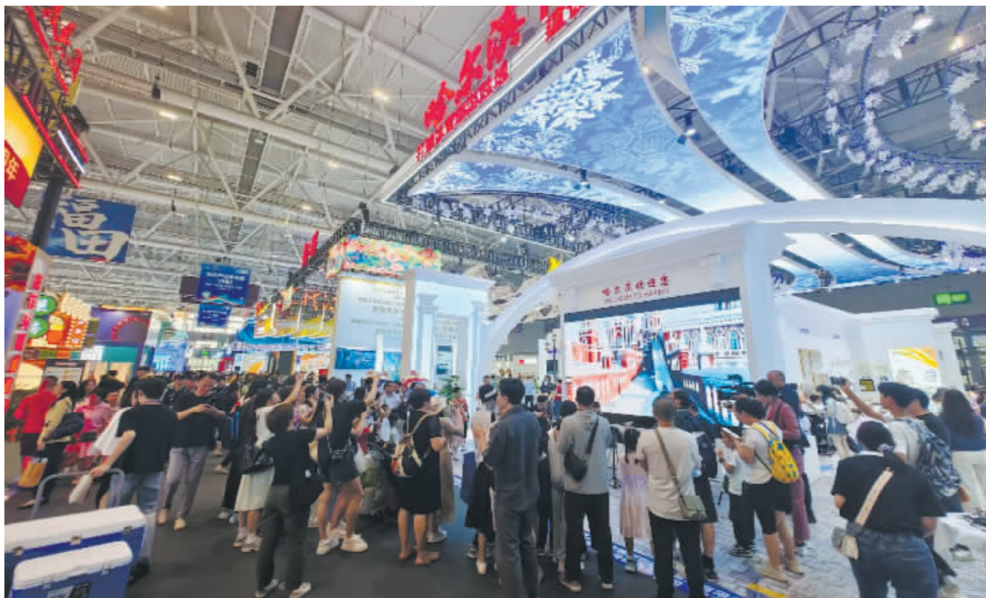
哈尔滨展馆吸引了众多观众。