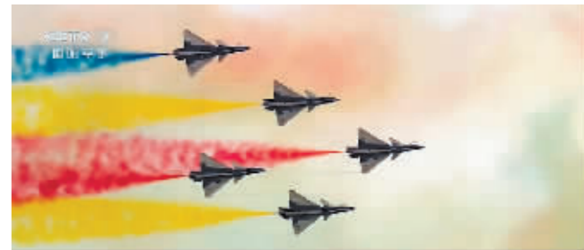
往届中国航展资料片。央视网发

央视网消息 第十五届中国航展将于今年11月12日—17日在珠海国际航展中心举行,目前各项筹备工作正有序推进中。