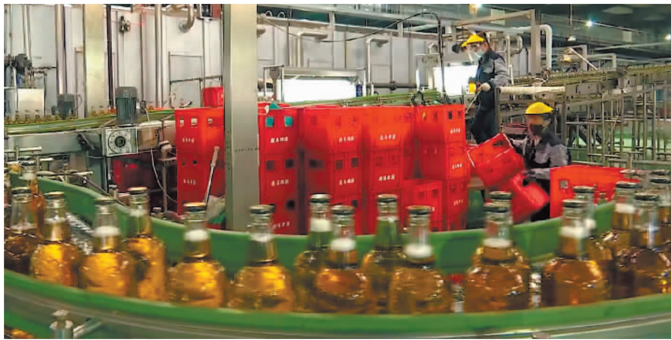
自动灌装流水线开足马力生产。