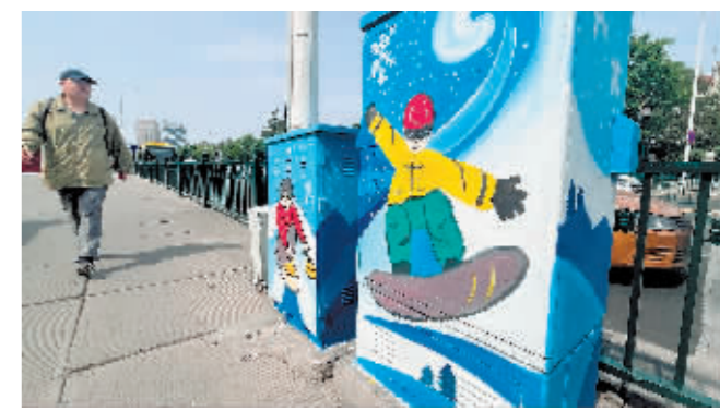
以单板滑雪为主题的彩绘配电箱。

本报讯(记者 霍亮)记者从市城管局获悉,为营造喜迎亚冬会浓厚氛围,倡导“礼迎亚冬”“滨滨有礼”文明新风,日前,哈市城管部门持续开展清洁美化行动。