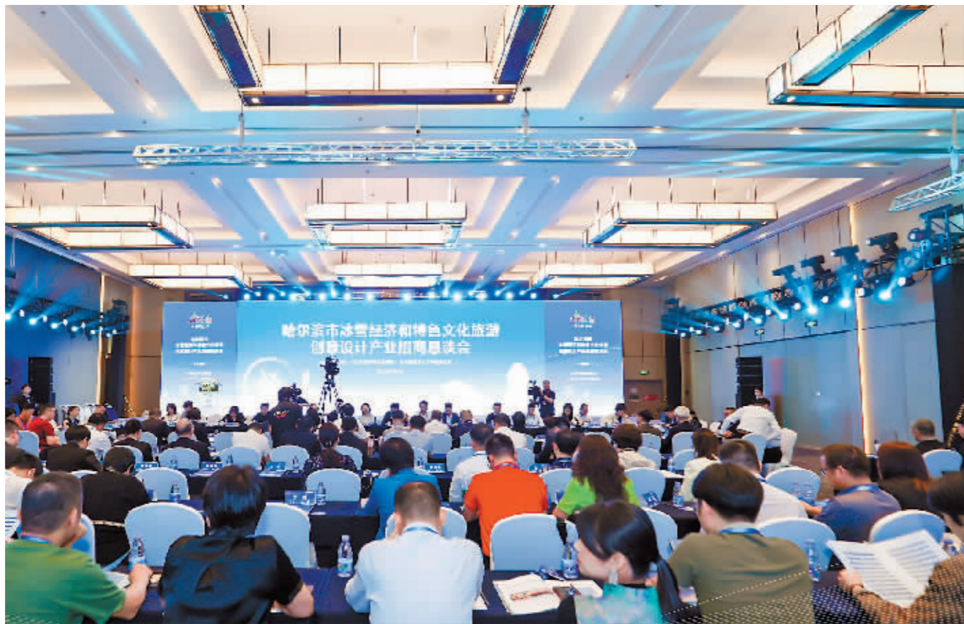
招商恳谈会现场。

深圳市中旅联控股有限公司彭鸣鸣表示，哈尔滨在冰雪旅游方面有着深厚的基础，具备爆发的潜力。“中旅联拥有10个自主IP品牌，多个项目适合哈尔滨。通过文旅IP方面深度合作，将沉浸演艺与多业态融合，塑造多种沉浸式体验场景的聚合空间，让游客深度体验哈尔滨的历史文