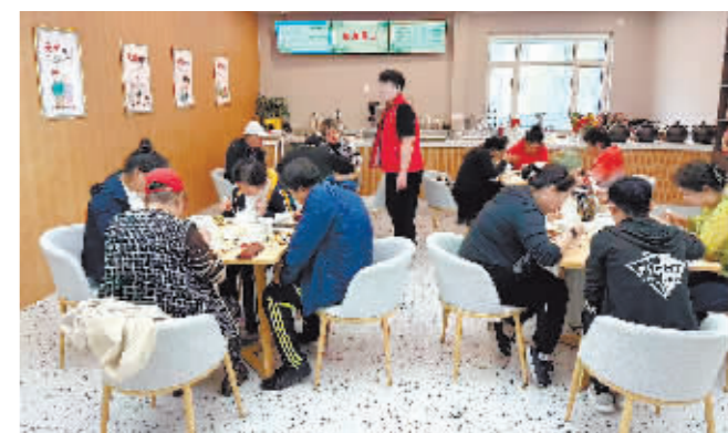
老年人在助老餐厅就餐。

本报(方爽 记者 梁可心)5月24日，南岗区菜市街老年人照护中心投用。“家门口有了老年人照护中心，不用去养老院也有专业人员照顾了，儿女省心，我们也舒心，还能和老邻居一起结伴养老，真的很幸福。”前来体验的辖区老年居民连连称赞。