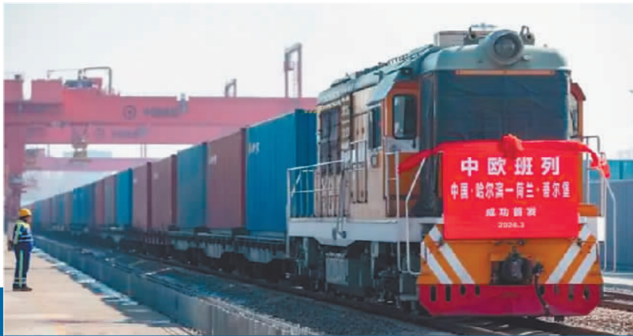
►2024年3月14日,中欧班列(哈尔滨—蒂尔堡)准备从哈尔滨国际集装箱中心站出发。

一季度,全省进出口总额同比增长10.3%,高于全国5.3个百分点。其中,出口同比增长52%,高于全国47.1个百分点,成为外贸新亮点。