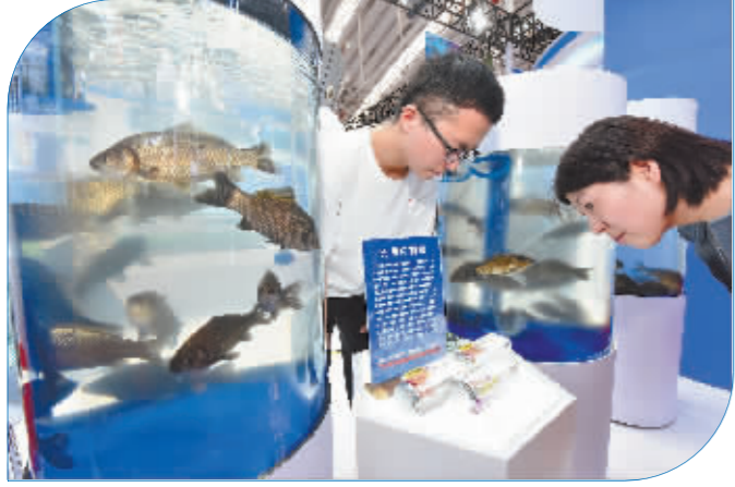
世界首例无肌间刺鲫鱼亮相展会。