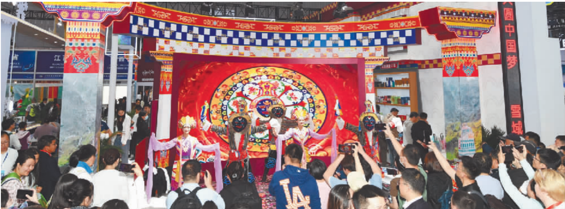
西藏歌舞节目循环演出，吸引人们驻足欣赏。