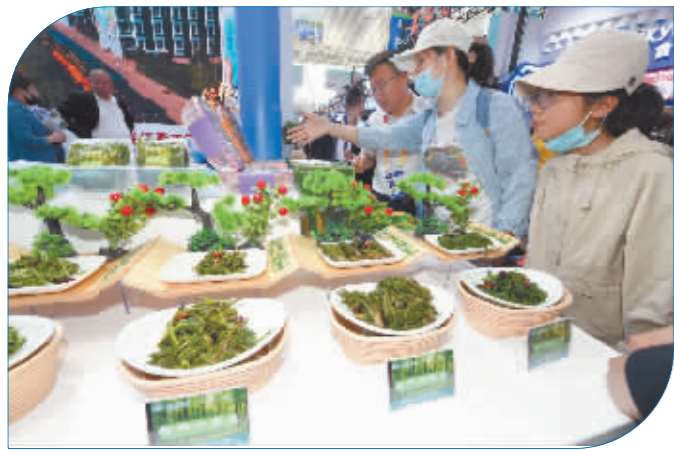
龙江森工的山野菜。