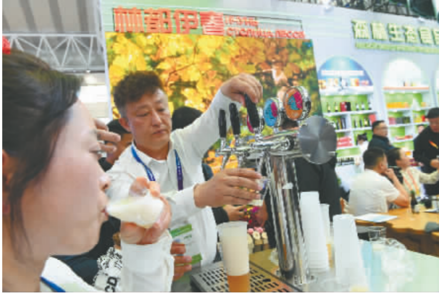
伊春的白桦树汁啤酒吸引人们排队品尝。