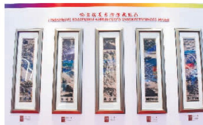
哈尔滨美术馆馆藏版画展示。