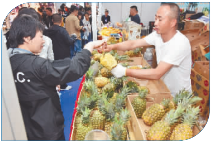
进口水果免费品尝。