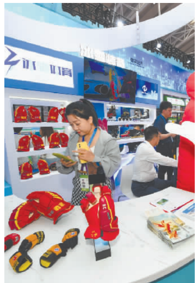
冰雪运动装备展区。