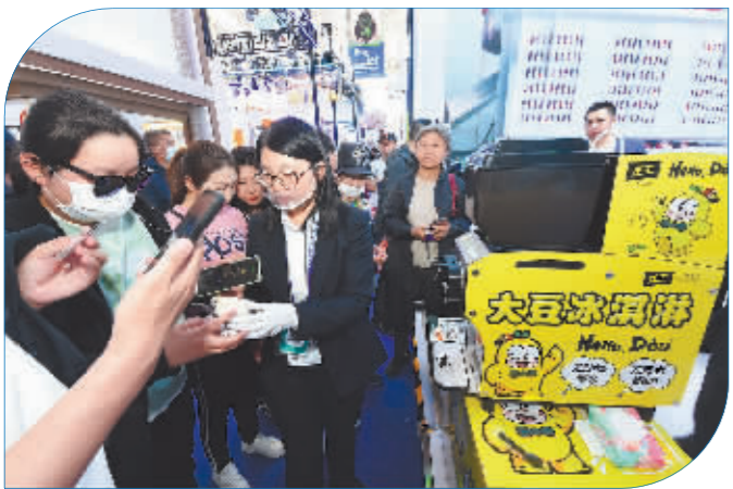
大豆冰激凌备受欢迎。