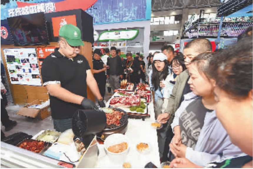
现场免费品尝齐齐哈尔烤肉。