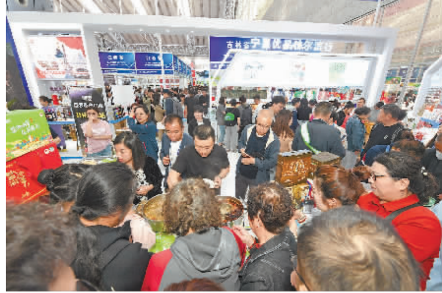
逛展者在宁夏回族自治区展区内免费品尝羊肉。