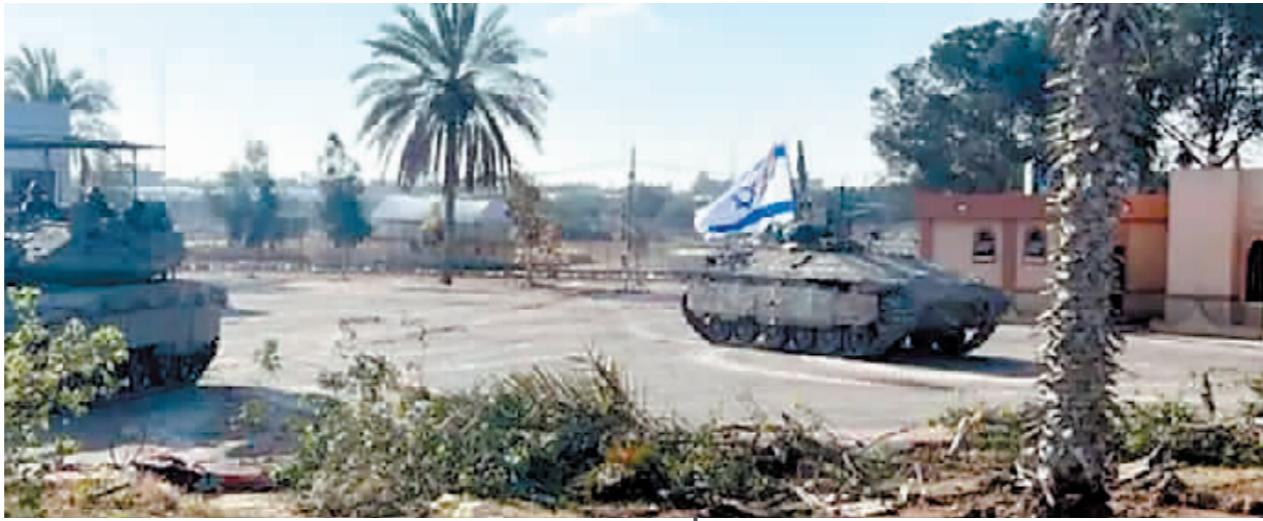
以军坦克在加沙开展军事行动。

去年 11 月以来,国际社会积极斡旋,就以色列和哈马斯再次停火组织多轮谈判,至今未能达成最终协议。