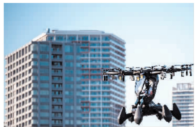
这是 5 月 17 日在日本东京拍摄的“飞行汽车”Hexa。这款名为“Hexa”的多旋翼飞行器能够在陆地上或水上着陆。