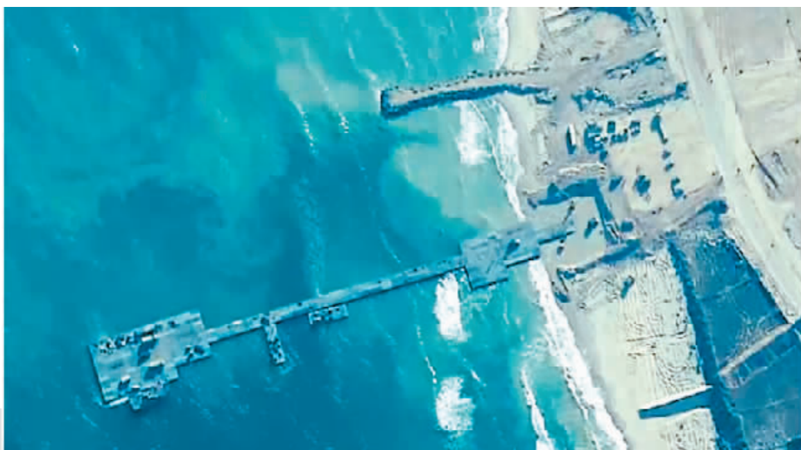
上图:美国在加沙地带中部海岸建造的临时码头。