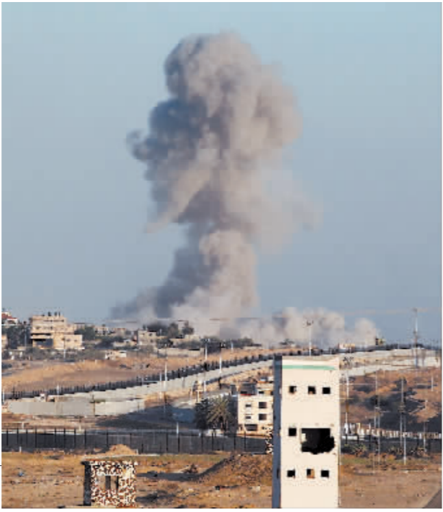
拉法遭以军轰炸后升起浓烟。