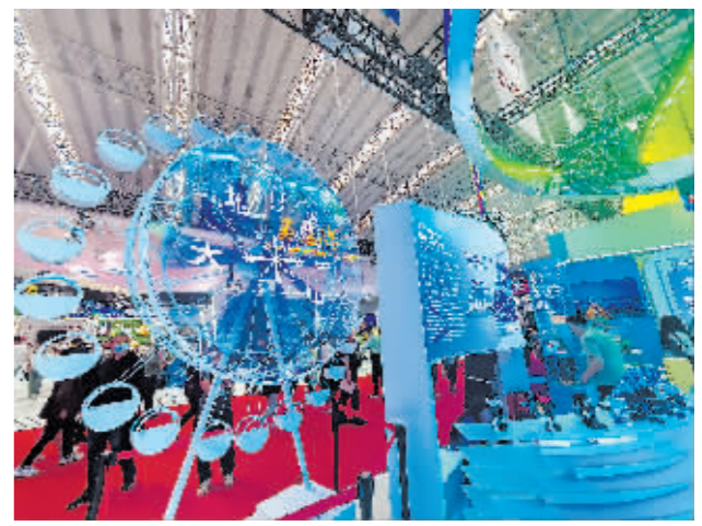
缩小版的冰雪大世界摩天轮。