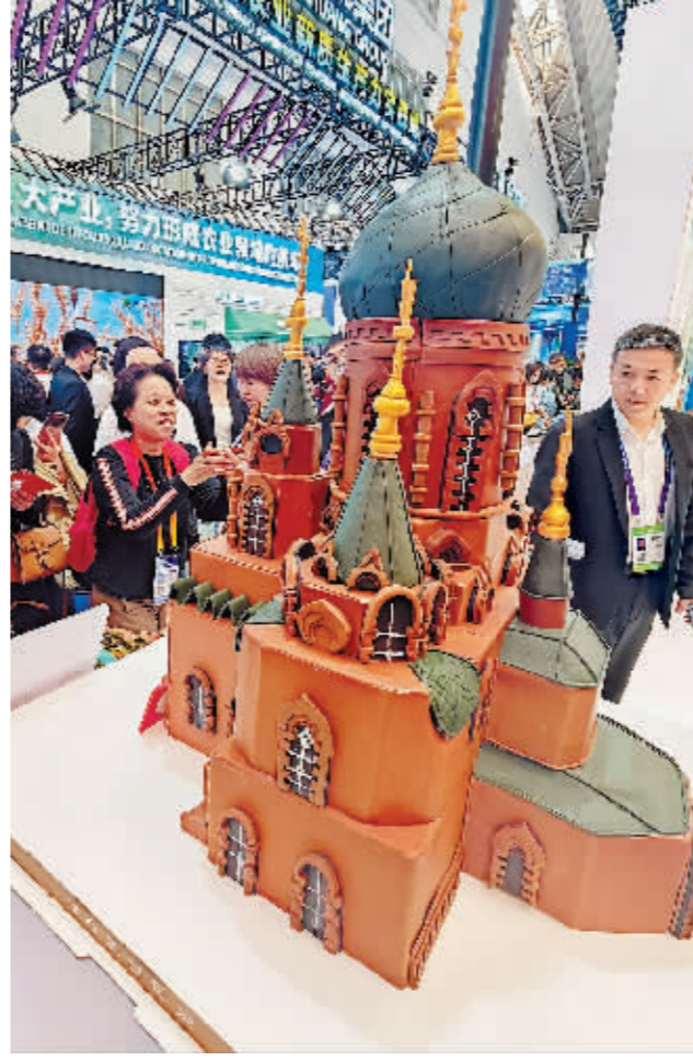
索菲亚教堂“蛋糕版”。