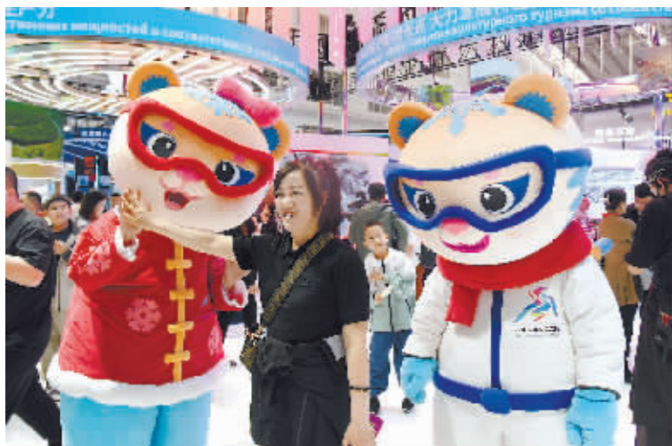
和亚冬会吉祥物“滨滨”“妮妮”合影。