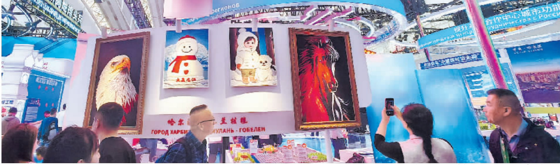
琳琅满目的冰城特色文创产品吸引众多参观者驻足。