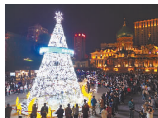
玉树琼花闪耀良夜。