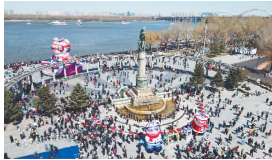
防洪纪念塔广场游人如织。