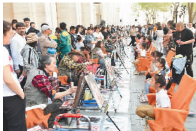
相约老街画廊,定格美好记忆。