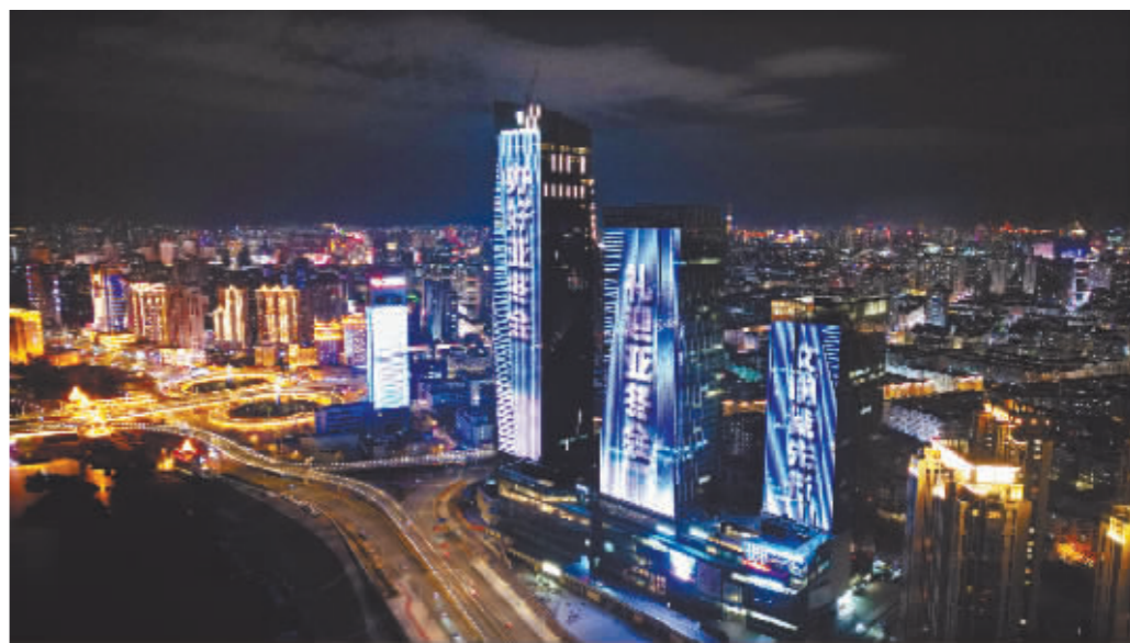
夜晚的哈尔滨更加迷人。