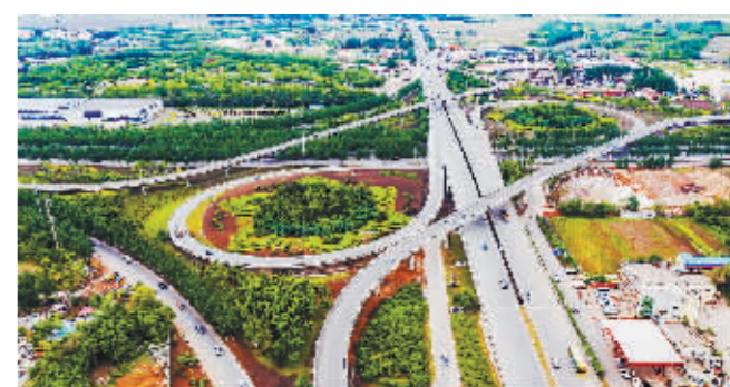
路畅街美,生机勃勃。

最美冰城五月天,天朗气清,惠风和畅。松江两岸、湿地湖沼,鸢飞鱼跃,生机盎然;桃李丁香,竞秀争妍,花影婆娑,暗香潮涌。中央大街洋溢欧陆风情,游人宛若漫步画中;中华巴洛克历史文化街区浓缩百年历史,感受时空闪回;博物馆、科技馆触摸经典启迪新知;大剧院、音乐厅天籁回响,音律婉转。大美冰城夏都正以最亮丽的状态喜迎八方来客。沉醉在这烂漫春光里,四海商客尽情享受哈尔滨的迷人景象、无穷魅力。