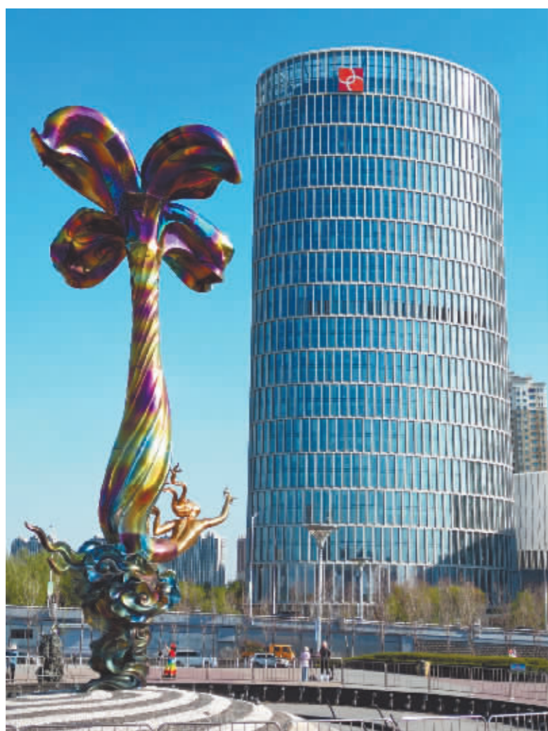
丁香公园景色怡人。