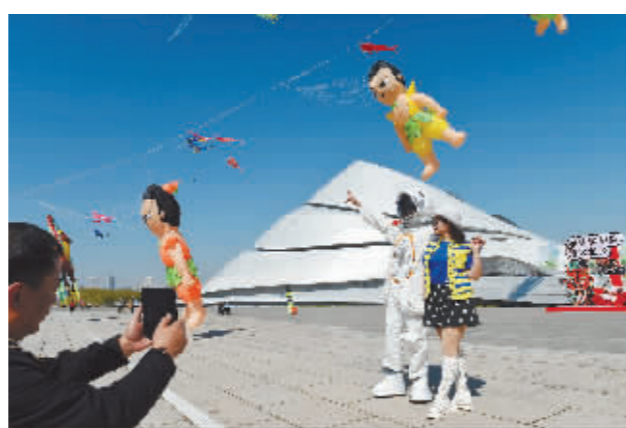
哈尔滨大剧院前人头攒动,风筝音乐会拉开帷幕。