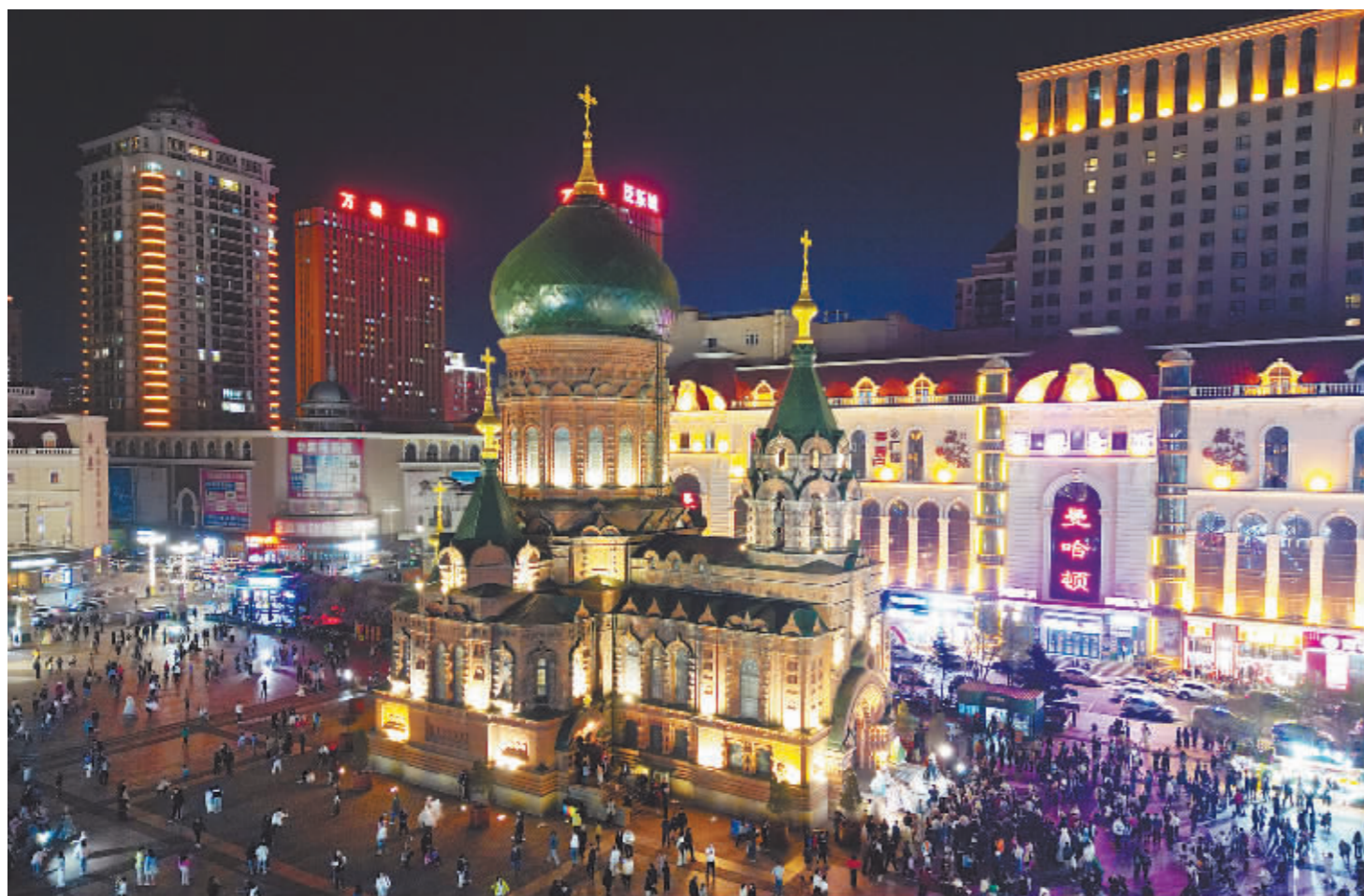
夜幕下的建筑艺术广场人潮汹涌。

最美冰城五月天,天朗气清,惠风和畅。松江两岸、湿地湖沼,鸢飞鱼跃,生机盎然;桃李丁香,竞秀争妍,花影婆娑,暗香潮涌。中央大街洋溢欧陆风情,游人宛若漫步画中;中华巴洛克历史文化街区浓缩百年历史,感受时空闪回;博物馆、科技馆触摸经典启迪新知;大剧院、音乐厅天籁回响,音律婉转。大美冰城夏都正以最亮丽的状态喜迎八方来客。沉醉在这烂漫春光里,四海商客尽情享受哈尔滨的迷人景象、无穷魅力。