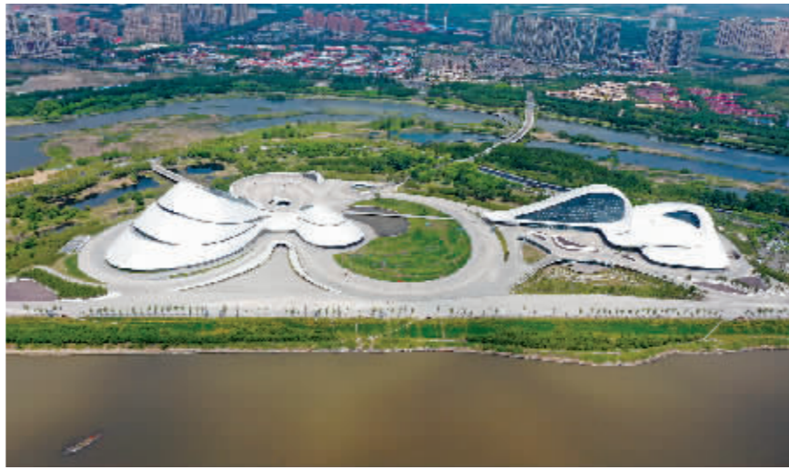
哈尔滨大剧院湿地风景秀丽。