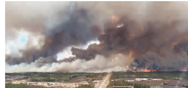
加拿大西部野火迅速蔓延。

据新华社电 由于加拿大西部野火蔓延迅速,逼近该国石油主产区艾伯塔省石油重镇麦克默里堡,当地政府14日说,已向该市南端四个居民区发布疏散令,大约6000人需要撤离。