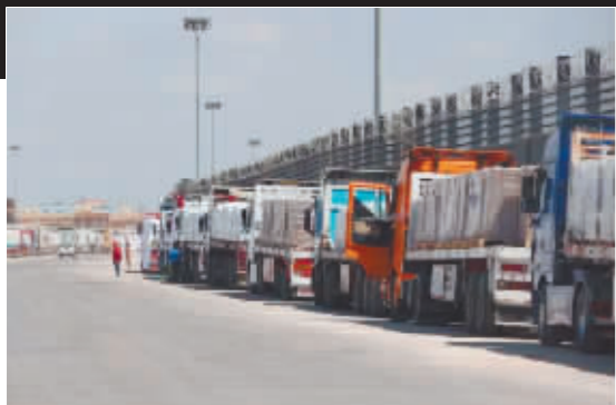
停靠在拉法口岸埃及一侧装有援助物资的卡车。

围绕是否开放加沙地带南部拉法口岸以使人道主义援助物资运入,埃及与以色列互相指责。美国媒体14日报道,埃及正考虑降级与以色列的外交关系。