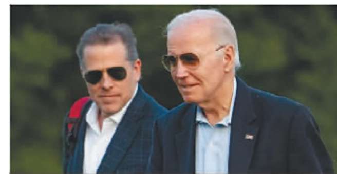
美国总统拜登与他的儿子亨特。

据新华社电 美国总统约瑟夫·拜登次子亨特·拜登下月可能分别在特拉华州、加利福尼亚州联邦法院因刑事案出庭受审。