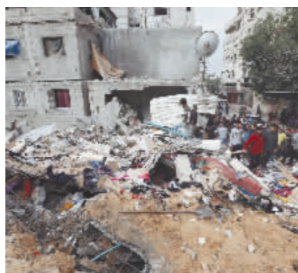
5月14日,在加沙地带中部努赛赖特难民营,人们查看以军轰炸后的建筑废墟。

拜登此前曾表示,如果以色列军队进攻拉法,美国将不会为其提供炸弹等武器,美方此前向以方提供的炸弹被用于杀害巴勒斯坦平民。