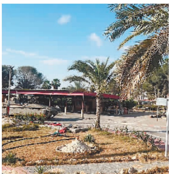
这张以色列国防军5月7日发布的照片显示,以军进入拉法口岸加沙一侧。