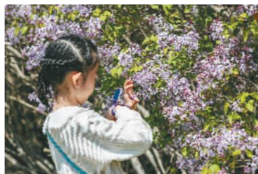
花团锦簇