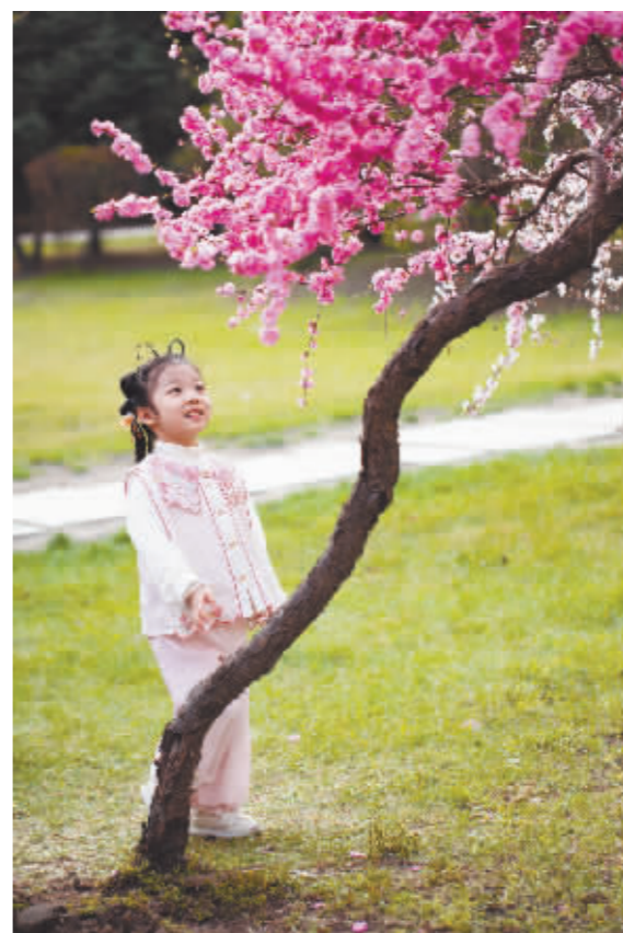
春花烂漫