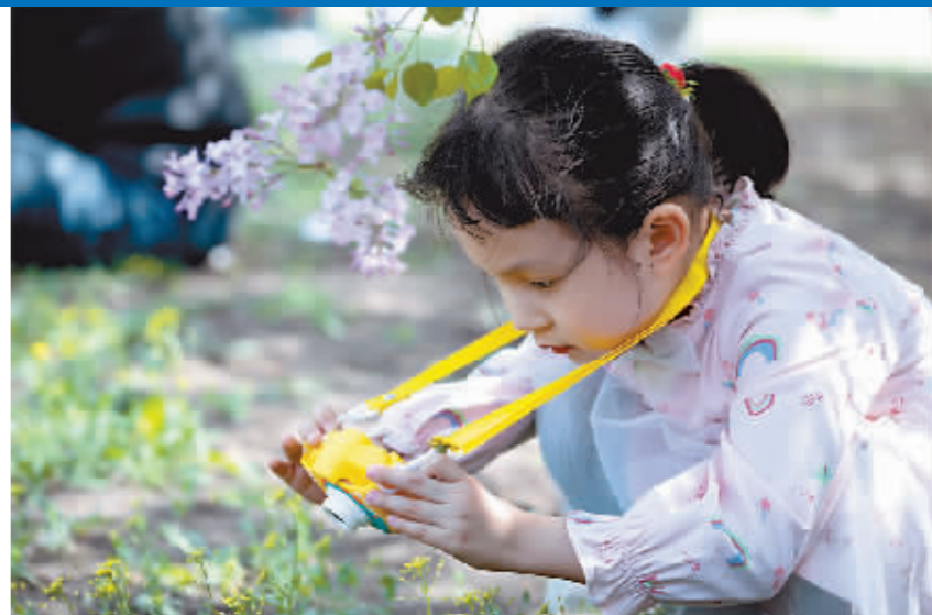
定格花颜