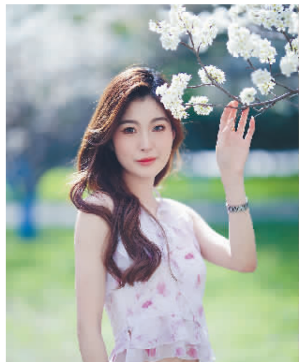
拈花一笑 曲财勇摄