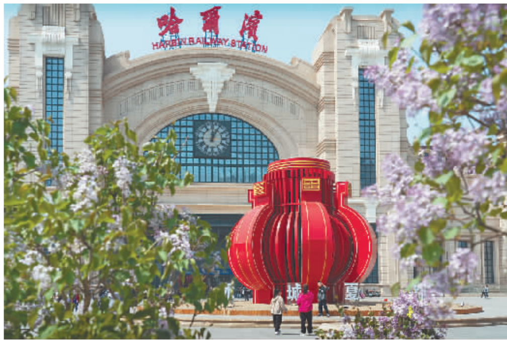
花漫枝头