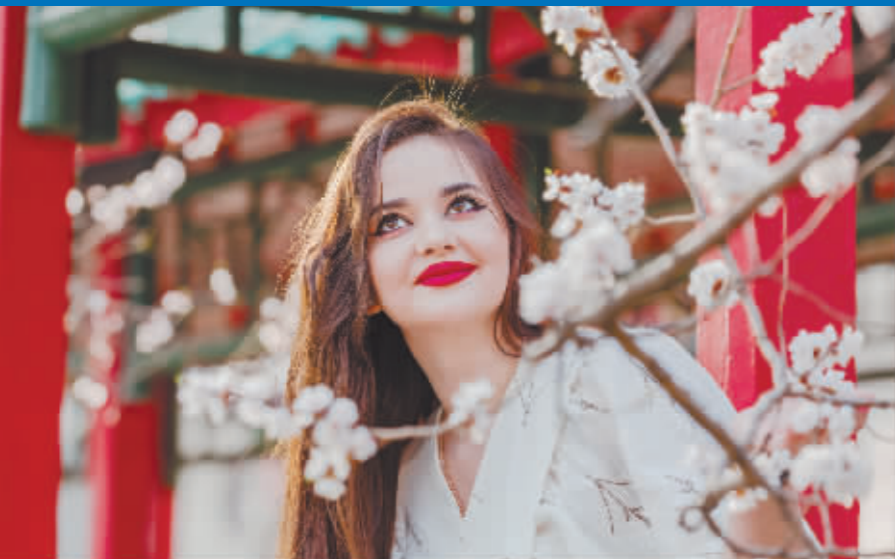
花容月貌