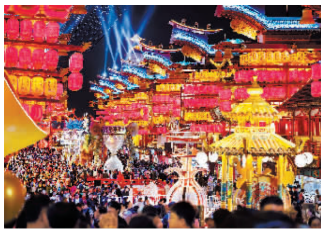
人们在新疆乌鲁木齐市水磨沟区天山明月城游玩。