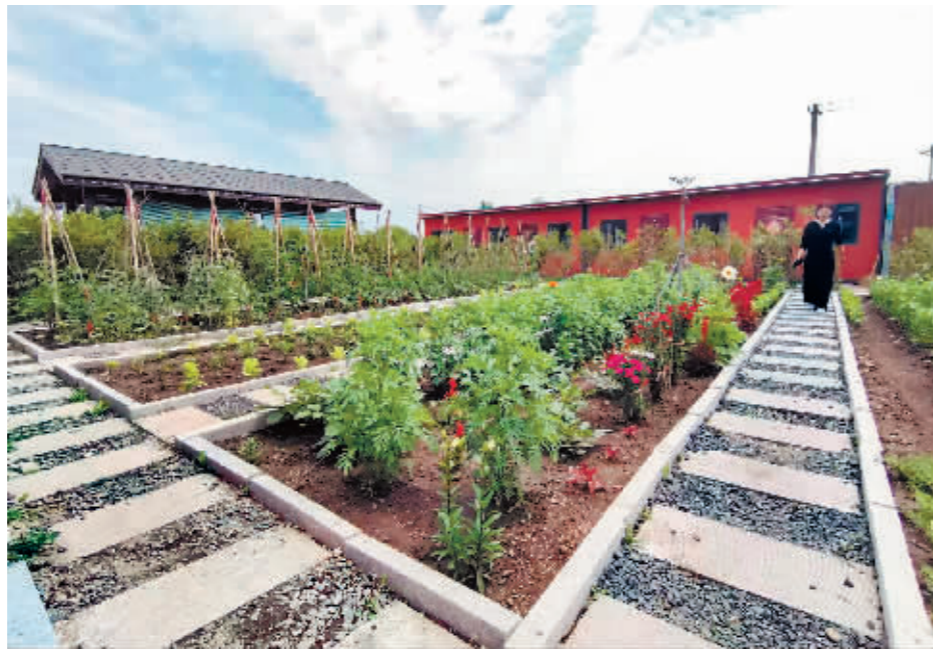
庭院内的共享菜园长势良好。

走进利鲜村,一处处恬淡怡情的景致随处可见,千米风俗长廊游人如织,跟着路标和游览导向图能走上两个小时,沿途是民俗风情园、特色美食街、乡村民宿。现场还有民族歌舞表演、打糕制作、辣白菜制作等活动,挑战大秋千和跷跷板是孩子们的最爱,